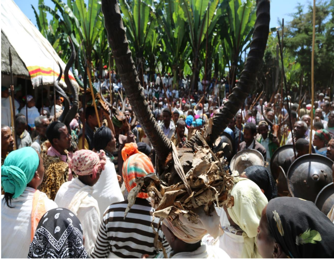
ፎቶ 6. ዚዛ(ሙሾ) ከዋኝና ታዳሚ

በክወናው አዲራው ሲቦን፣ የደከመው ሲወጣ፣ አዳዲሶች ሲቀላቀሉ እጅግ እየደራ ይሄድና ለቅሶ ቦታ መሆኑ ቀርቶ ወደ ፍጹም ጭፈራነት ይቀየራል። በዚህ ጊዜ ካሞ (የሚች ሴት ልጆች ወይም እህቶች) በለቅሶ ጩሄት ዚዛውን በመበተን ወደ ሀዘን ድባብ ይቀይሩታል። ካሞ የሚባሉት ትዳር ይዘው የሚኖሩ የሚች ሴት ልጆች ወይም እህቶች ጋር የለቅሶ ስርዓቱን የሚያደምቅ ቡድን ሲሆን ለቅሶ ሲከሰት በአምችና ቡድናቸው ተደራጅተው ወደ ለቅሶ ቤት በመምጣት በጩኸት ለቅሶውን የሚያደምቁ ናቸው። እነዚህ ካሞዎች ሲመጡ ስሜታቸው እጅግ የሚያስፈራ ነው። ማንም ሊያስቆም የሚችል ዓይነት አይደለም። ሁለቱንም እጃቸውን እያወራጩ ኡ፣ ኧሉ ኡ፣ ኡ፣ ኡ...እያሉ የሚች ቤት ደጅ እንደደረሱ የሚችን ሳር ቤት ቦጭቀው በመጣል፣ የእንሰት ችግኞችን በመነቃቀል፣ የትልልቅ እንሰቶችን ቅጠል በመቆራረጥና እቤት ውስጥም ጭምር በመግባት እህል አውጥተው በመበታተን የለቅሶውን ድባብ እጅግ ኃይለኛ ስሜት እንዲኖረው የሚያደርጉ ናቸው። ይህ ስሜት የሚንጸባረቀው ከዛሬ ጀምሮ ሁሉም አበቃ፣ መልካሙ አባታችን ወይም ወገናችን እንኳ