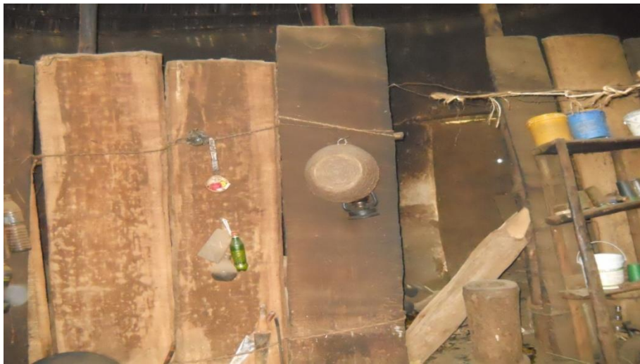
ፎቶ1. ለአስክሬን ሳጥን ተዘጋጅቶ የተቀመጠ ዞዳ(ባህላዊ ጣውላ) ሰሙ አዋሾ ቀበሌ።

በብሄረሰቡ ዘንድ የልምላሜና የቀጣይነት ተምሳሌት ነው። ሁለቱ ዘዳዎች በእንሰት ማሳ ውስጥ የሚተክሉበት ምክንያት የሁለቱ ዛፎች በጋና ክረምት ቅጠላቸው የሚረገፈው በመፈራረቅ ነው። እነዚህ ዛፎች በእንሰት ማሳ ውስጥ ካሉ በየትናውም ወቅት ማሳው ለምለም ነው። በዚህም ምክንያት ሽማግሌዎች በሚመርቁበት ወቅት ቴኔ ችሬፋዎ (ሾላህ ይለምልም)፣ ኮቾኔ ችሬፋዎ (ኮርችህ ይለምልም) ማለትን ፈጽሞ አይዘነጉም። እነዚህ ዛፎች ምልክትነታቸው የህይወት ወይም የትውልድ ቀጣይነትን ትዕምርታዊ መልዕክት የሚስተላልፉ ናቸው።