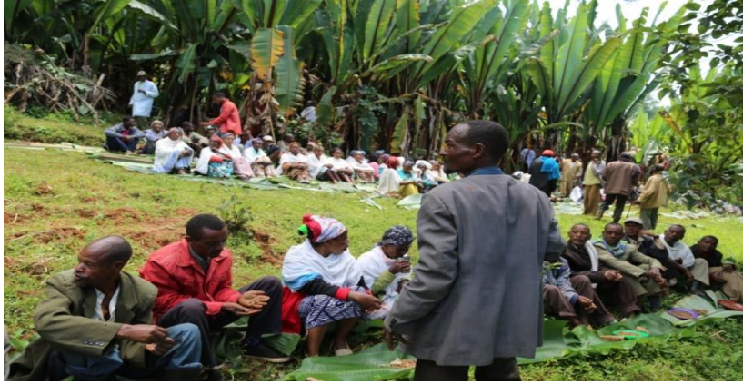
ፎቶ.8. ለቀስተኞች በአካኒ ኡሹ(የእዝን መስተንግዶ) ላይ።

ወደ ቀብር ጉዞ የሚጀመረው ከ6 እስከ 7 ሰዓት ባለው ጊዜ ውስጥ ነው። ለቀብር ከቤት መውጫ ሰዓት ላይ ቃሬላው የሚቀመጥበት የእንሰት ቅጠል ተቆርጦ ይመጣና ከቤቱ በረንዳ ላይ ይነጠፋል። የቀብር ሰዓቱ ሲደርስ የአካባቢው አዋቂ ወንዶች ቃሬላውን ለአራት ሆነው በጋቢ ወይም በቡሉኮ አልብሰውት በጓሮ በኩል ዞረው ፊት ለፊት ይዘው ይመጡና ወደ ቤት ውስጥ ሳይገቡ መውጫ በሩ ጋ በጋቢ ሸፍነው ይቆማሉ። ከቤት በኩል ደግሞ እንደዚሁ አራት ሰዎች አስክሬኑን ይዘው ቃሬላው ውስጥ ያስገባሉ። ከዚያም ወደ ውጭ ያወጡና አስቀድሞ በተነጠፈው የእንሰት ቅጠል ላይ ለአምስት ደቂቃ ያህል ያሳርፉና እንደ አዲስ ከፍተኛ ለቅሶ ይሆናል። በዚህ ቀብር ቦታ መሄድ የማይችለው በደንብ አልቅሰው ይሰናበታል። ከዚያም አራት ሰዎች አስክሬኑን በቃሬላ ተሸክመው ወደ ቀብር ቦታ ጉዞ ይደረጋል። በጉዞው ወቅት የሚኖረው ለቅሶ መጠነኛ ሲሆን ባብላሻው የሚች ሌተሰቦች ናቸው የሚያለቅሱት። ነገር ግን መንገድ ላይ እያሉ ከቀብር በፊት ያልደረሱ የሚች ዘመድ ቢመጡ አስክሬን የተሸከሙት ትንሽ ቆም ይሉና ከተለቀሰ በኋላ ነው እንደገና ጉዞ የሚጀመረው።