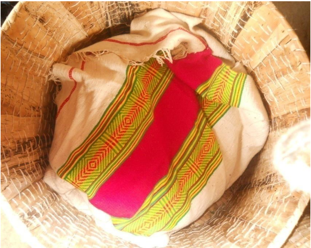
ፎቶ 2. ኪኖ (የክፈን ልብስ)

ኪኖ በቀለም ደረጃ ነጭ አብዛኛውን መጠን የሚይዝ ሲሆን ቀጥሎ ያለውን ደረጃ የሚይዘው ቀይ ቀለም ነው። ከነዚህ ውጭ ቢጫ፣ አረንጓዴ፣ ቡኒ፣ ሎሚ፣ ወይንጠጅ ቀለሞች ነው የሚሰራው። ይህ ኪኖ ለዘወትር ልብስነት የሚውል ሳይሆን ሞት ሲከሰት በቤት ጣሪያ ላይ ተዘርግቶ የሚቀመጥና ለክፈን ብቻ የሚያገለግል ነው። የክፈን ልብሱ ከአካባቢው ሸማኔዎች በትዕዛዝ ተሰርቶ ወይም ከገበያ ተገዝቶ ከዚህ በታች በፎቶ በተመላከተው ሾሮዶ በሚባል የብሄረሰቡ ባህላዊ የልብስ ማስቀመጫ ሳጥን ውስጥ ነው በየቤቱ የሚቀመጠው።