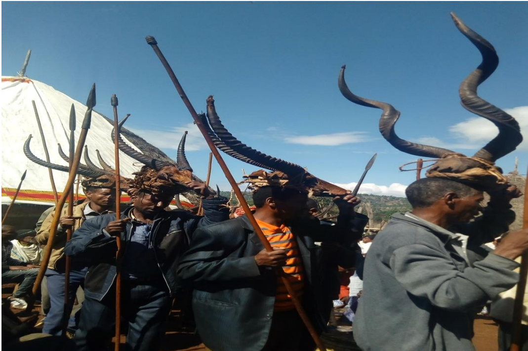
ፎቶ 6. የ«አኸያ» ዚዛ ክወና

በዚህ ቅኝት የሚከናወነው ውዝዋዜ የከዋኞች ግራ እግር ሙሉ በሙሉ ከመሬት ሳይነሳ ከጉልበት ሰበር በማድረግ የቀኝ እግር በመጠኑ ይነሳና ከትከሻም ጭምር በማስማማት በሌሎች ቁሶች ምት ታጅቦ የሚተወን ነው። የከዋኞች ፊት ሙሉ በሙሉ ወደጎንም፣ ፊት ለፊትም የሚተያይ ሳይሆን በፊት መሪው አማካይነት በክብ የሚዞርበት ነው።( ምልክታ በ21/8/2011 ዓ.ም)