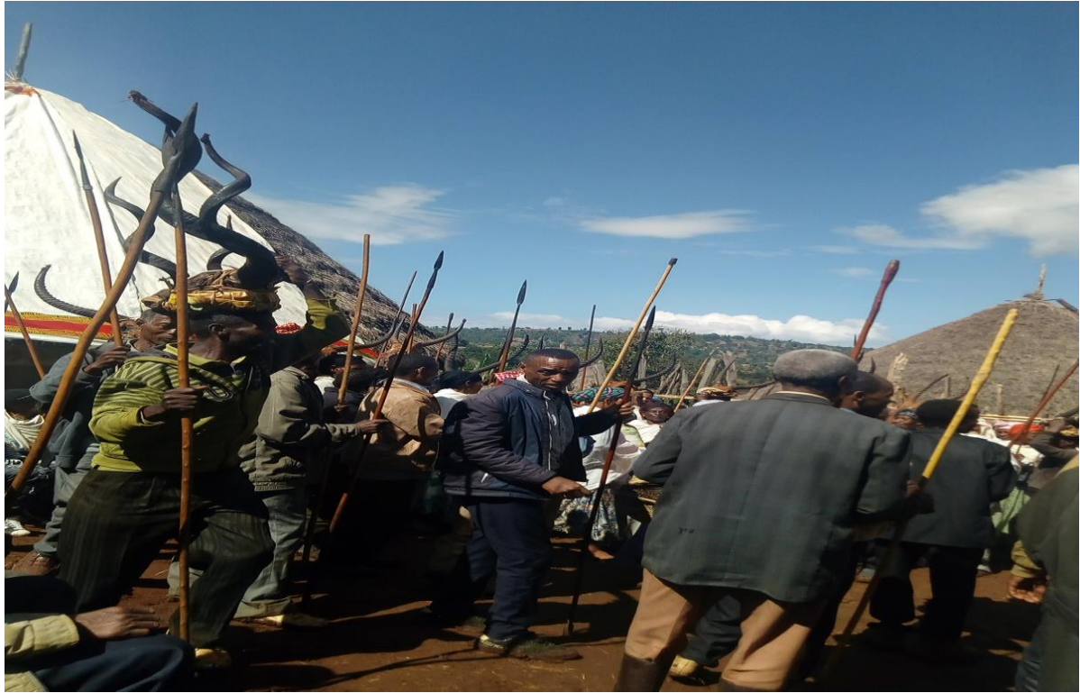
ፎቶ 4. ወንዶች ቴሻ (የለቅሶ) ስርዓት ሲከውኑ።

ቁጭት መግለጫ ስሜት ነው። አሁን ይህ ቀርቷል። ወንዶች ለቴሻ ሲሄዱ ጦር ይዘው ነው የሚሄዱት። ሽማግሌዎች ጋቢ ለብሰው፣ ጎልማሶችና ወጣቶች ከስራ ልብሳቸው በስተቀር ማንኛውንም ዓይነት ልብስ ለብሰው ነው በአንድላይ የሚሄዱት። ከለቅሶ ቤቱ ደጅ እንደደረሱም ሽማግሌዎችን በማስቀደም ሌሎች በእድሜያቸው ይሆኑና ሽማግሌዎች ጋቢአቸውን አገልድመው ወገባቸውን በማሰር ለቅሶውን ይመራሉ። ሁሉም የጦር ዘንጋቸውን እያወራጩ፣ ጭንቅላታቸውን በቁጭት እየነቀነቁ፣ ወደ ሀዘንተኞቹ ሄድ መለስ እያሉ አዳኝ ከሆነ ወደ አደን የሄደበትን ቦታ እየጠፉ፣ ከብት አርቢ ከሆነ የሚያሰማራባቸው አካባቢዎች እንዲሁም ደረባውን እየጠፉ፣ የሟች የዘር ሀረግ ወጥቶ የሚገባበትን ቦታ ሁሉ እየጠፉ ነው እያለቀሱ ሀዘንተኞችን የሚያስለ ቅሱት። ለምሳሌ በዚህ ሰዓት ከሚደረደሩ ማልቀሻ ቃላት መካከል የሚከተሉት ይገኛሉ።