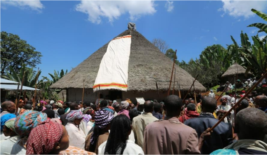
ፎቶ 5. የአባወራ ሞት ቴሻ(ለቅሶ) ስርዓት ክወና።

ለሴት አዛውንቶች የሚፈጸመው የለቅሶ ስርዓትም እንደወንድ አዛውንቶች በቴሻ ስርዓት ነው የሚከወነው። እንደ አቶ ገዛኸኝ ገለጻ ቀደም ሲል ለሴቶች የዚህ ስርዓት የማይከወን ቢሆንም ከጊዜ በኋላ ለማንኛውም ሰው እንደሚከወነው ሁሉ ቀንድ ተይዞ ዚህ እየተካሄደ ነው። ነገር ግን አባወራው እያለ ቀድማ የሞተች እንደሆነ ኪኖ (ከፈን/ቡሉኮ) የሚነጠፈው የቤቱ ጣሪያ ላይ ሳይሆን አጥር ላይ ነው። አባወራው ቀድሞ የሞተ እንደሆነ ግን ኪኖው የሚነጠፈው የቤቱ ጣሪያ ላይ ነው። እንደዚሁ እናት ልጅ ቤት እየተጠረጠረች የሞተች እንደሆነም ኪኖው የልጅ ቤት ላይ አይነጠፍም። ምክንያቱ ደግሞ አባወራውን ይገድላል ተብሎ ስለሚታምን ነው። አልፎ አልፎ ዚህም የማይፈቅዱ አካባቢዎች አሉ። (ቃ.መ.16/7/20 11)።