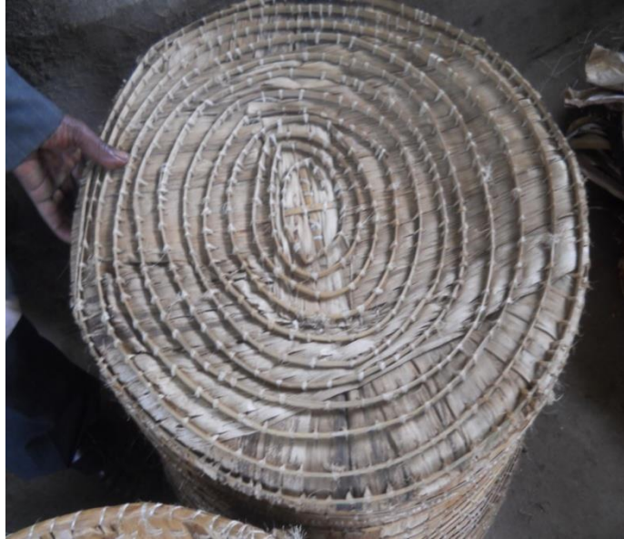
ፎቶ 3. ለዚህ ክፍና ማጀቢያነትና ለልብስ ማስቀመጫነት የሚያገለግል ሾሮዶ

እነዚህ ከላይ የተዘረዘሩ ሞት ሲከሰት የተለየ አገልግሎት የሚሰጡ ቁሶች ሞት መከሰቻ ጊዜና መንገዱ ስለማታወቅ ከተከሰተ በኋላ ፍለጋ ከመራራቱ አስቀድመው የሚዘጋጁ ናቸው። ይህም «ሰው የተወለደ ዕለት ነው የሞተው ነፍሱ ከስጋው የምትለይበትን ቀን እንጂ ያላወቀው» የሚለውን የብሄረሰቡን አስተሳሰብ የሚያመላክት ዝግጅት ነው። ሰው በህይወት ዘመኑ ተንቀሳቃሽ ሬሳ መሆኑን ለማመላከት የአስክሬን መከፈኛ ቁሶች ጭምር ነፍስ ከስጋው እስከምትለይ ድረስ አብረውት እንዲኖሩ ይደረጋል።