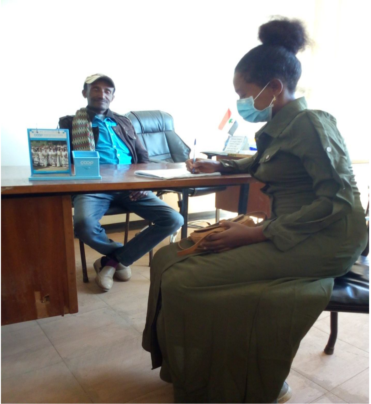
Suuraa 8. Afgaaffii qabsa' aafi hojjeetaa mana kitaabaa Waajjiira Aadaafi Tuuriziimii Aadaa Dagam Buzunaa Taddasaa wajjiin guyyaa 26/02/2013 adeemsiifame