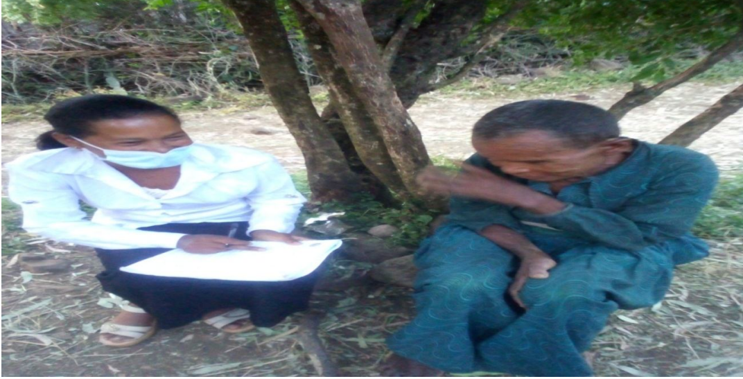
Suuraa 1. Yeroo Afgaaffiin Ad. Qacinee Badhaasaa wajjiin guyyaa 24/02/2013 adeemsifame