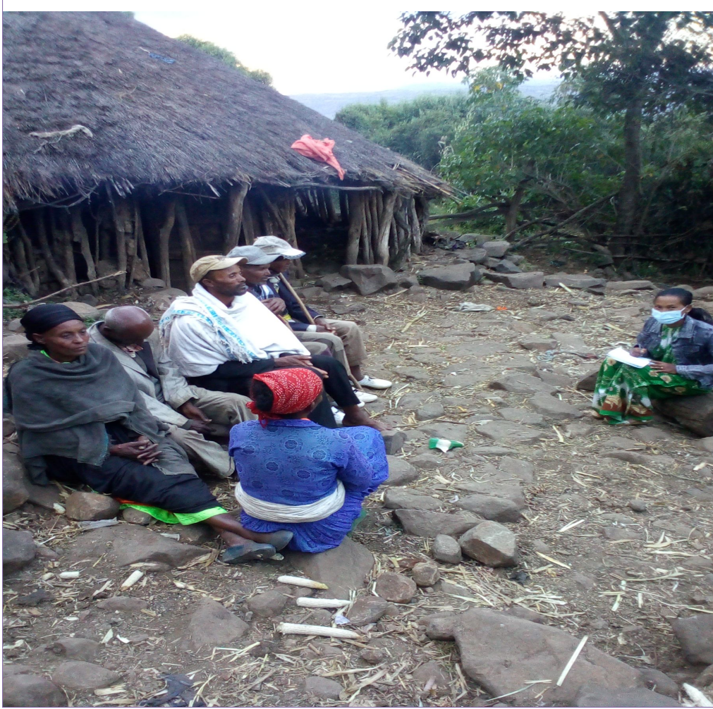
Suuraa 10. Yeroo Mariin Garee xiyyeeffannoo 02/20/2013 Adeemssifamu