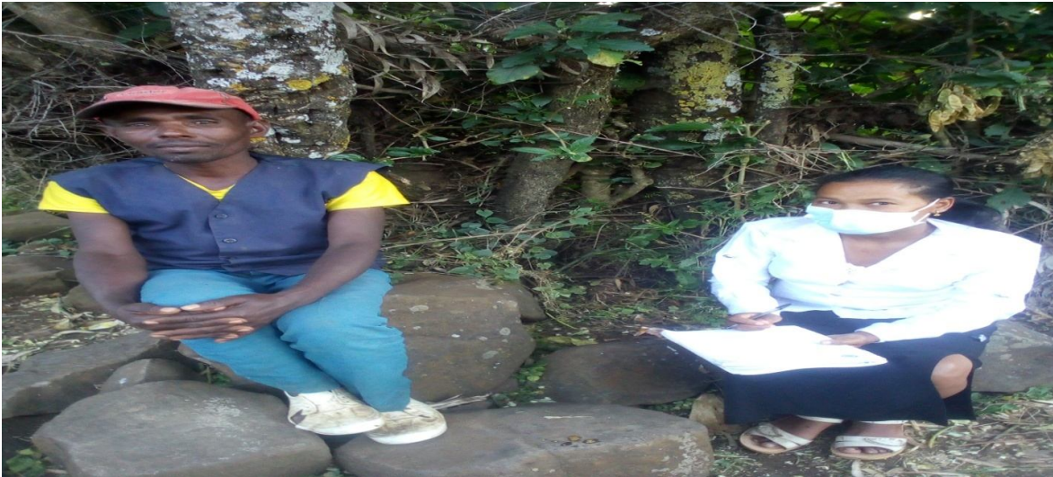
Suuraa 2. Yeroo afgaaffiin ob.Tolasaa Garradoo guyyaa guyyaa 26/02/2013 adeemsiifame