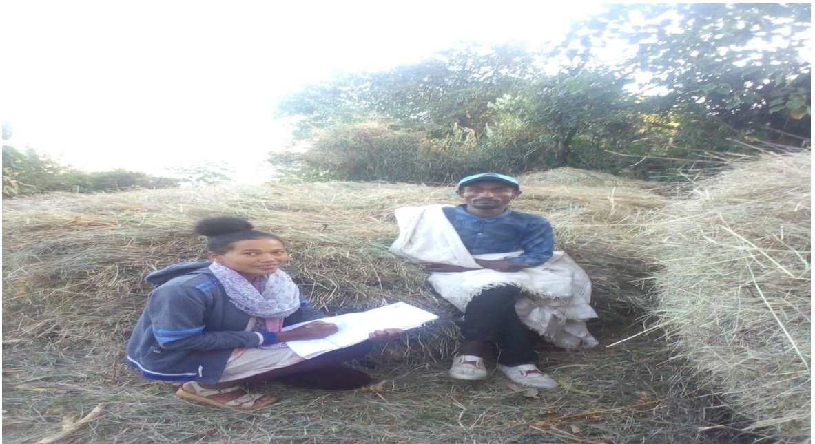
Suuraa 5. Afgaaffi Ob. Assaffaa Tacaanee wajjiin guyyaa 26/02/2013 adeemsifame