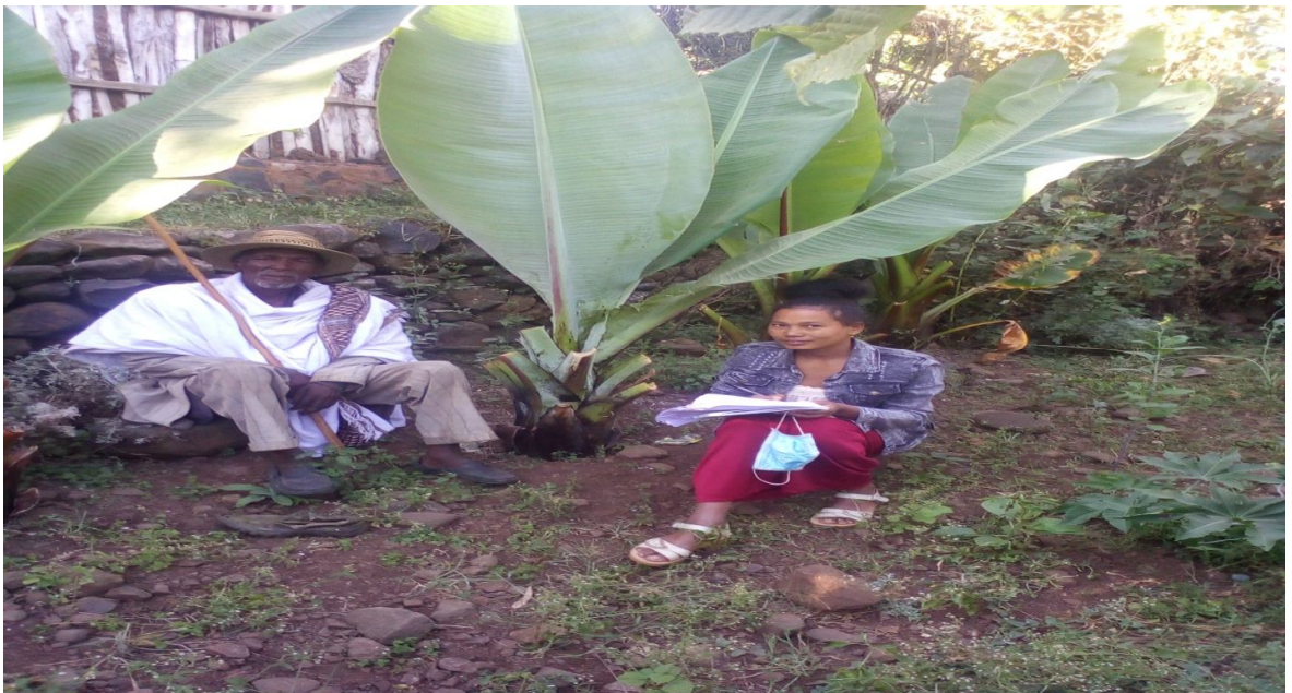
Suuraa 7. Afgaaffi Ob. Iraasuu Tufaa wajjiin guyyaa 26/02/2013 adeemsiifame.