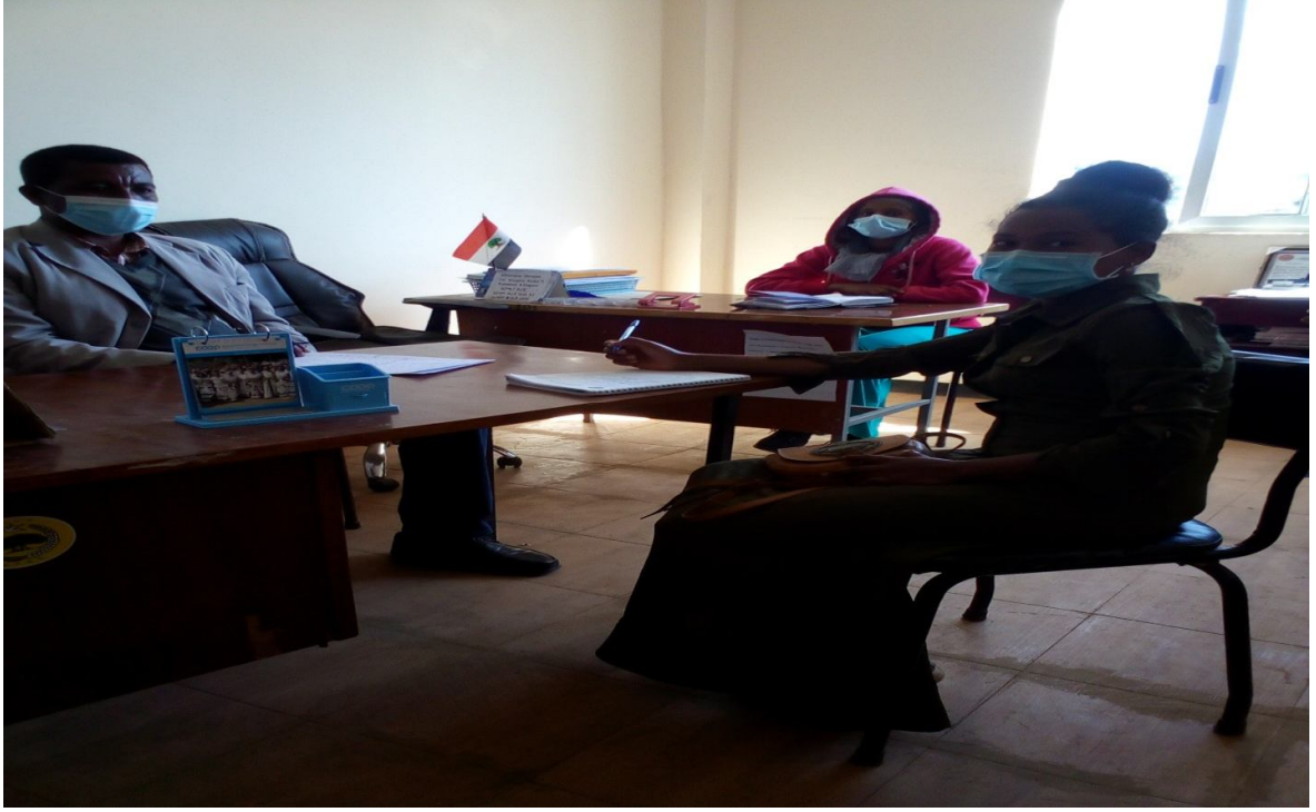
Suuraa 9. Afgaaffii yeroo hojjeetoota Wajjira Aadaafi Tuuriziimii Aanaa Dagam wajjiin guyyaa 18/02/2013 adeemsifame