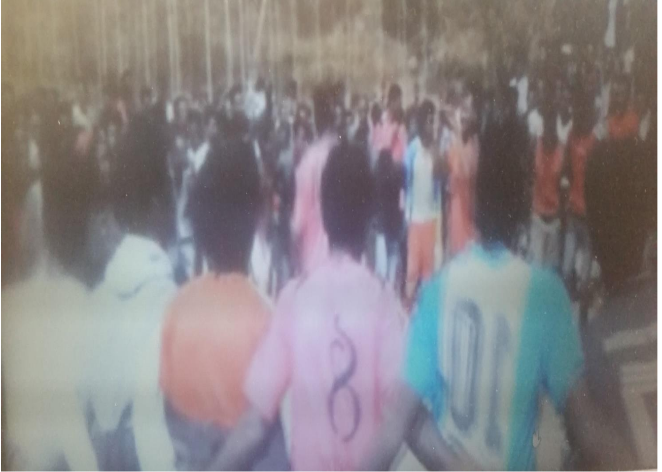
Fakii 1: Aanaa Giddaatti yeroo dargaggoonni yeroo sirba geelloo sirban