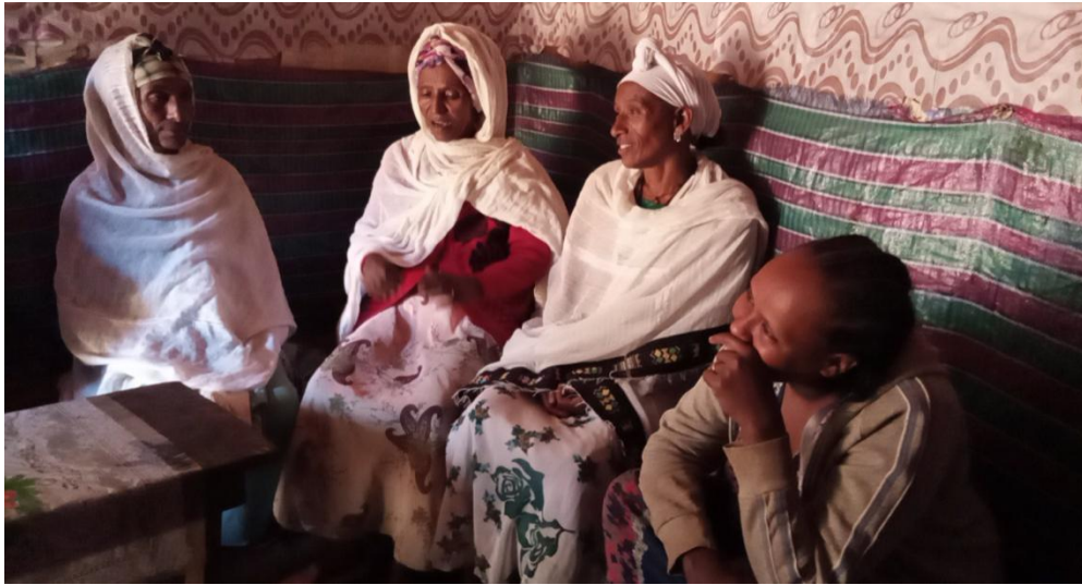
Fakii 3: Marii garee Giddaatti taasifame Caamsa 03/2013

Ragaan asiin gaditti dhihaate ergaa garaagarummaa garee hawaasaa keessatti argamu ibsee ibsee jira. Ragaan kunis marii gareen akkuma fakii itti aanee jirurratti mul’atu argame.