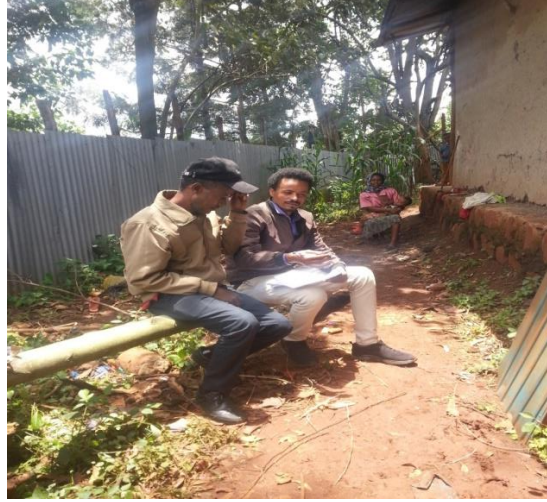
Afgaaffii Aanaa Giddaatti yammuu gaggeeffamu