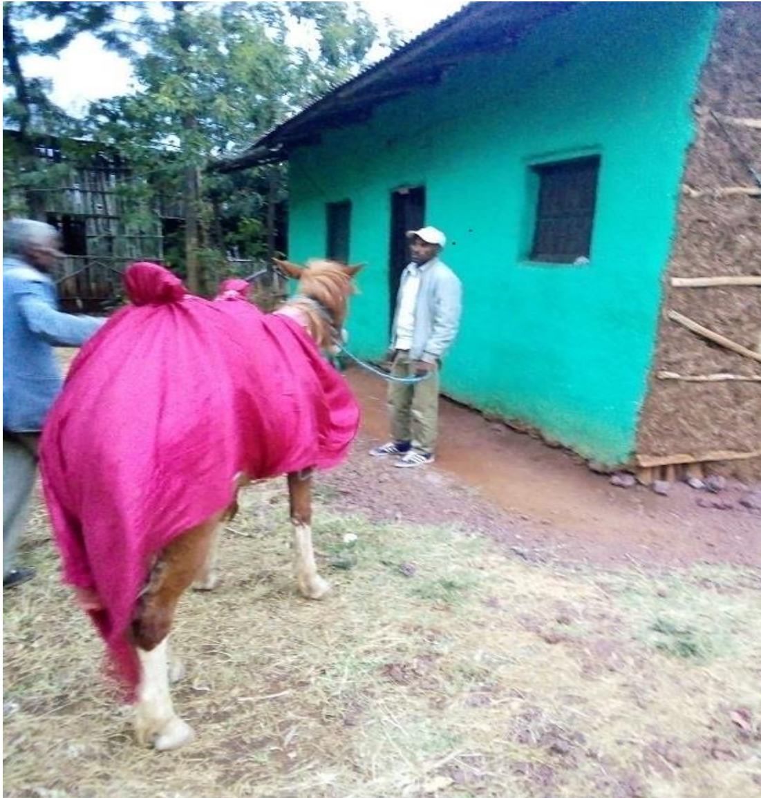
ፎቶ:8 ፈረስ በቀሚስ “ፈርደ ቀሚሲ”