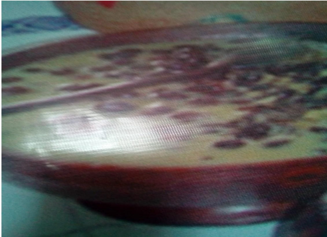
ፎቶ : 16 “ቡና ቀላ”