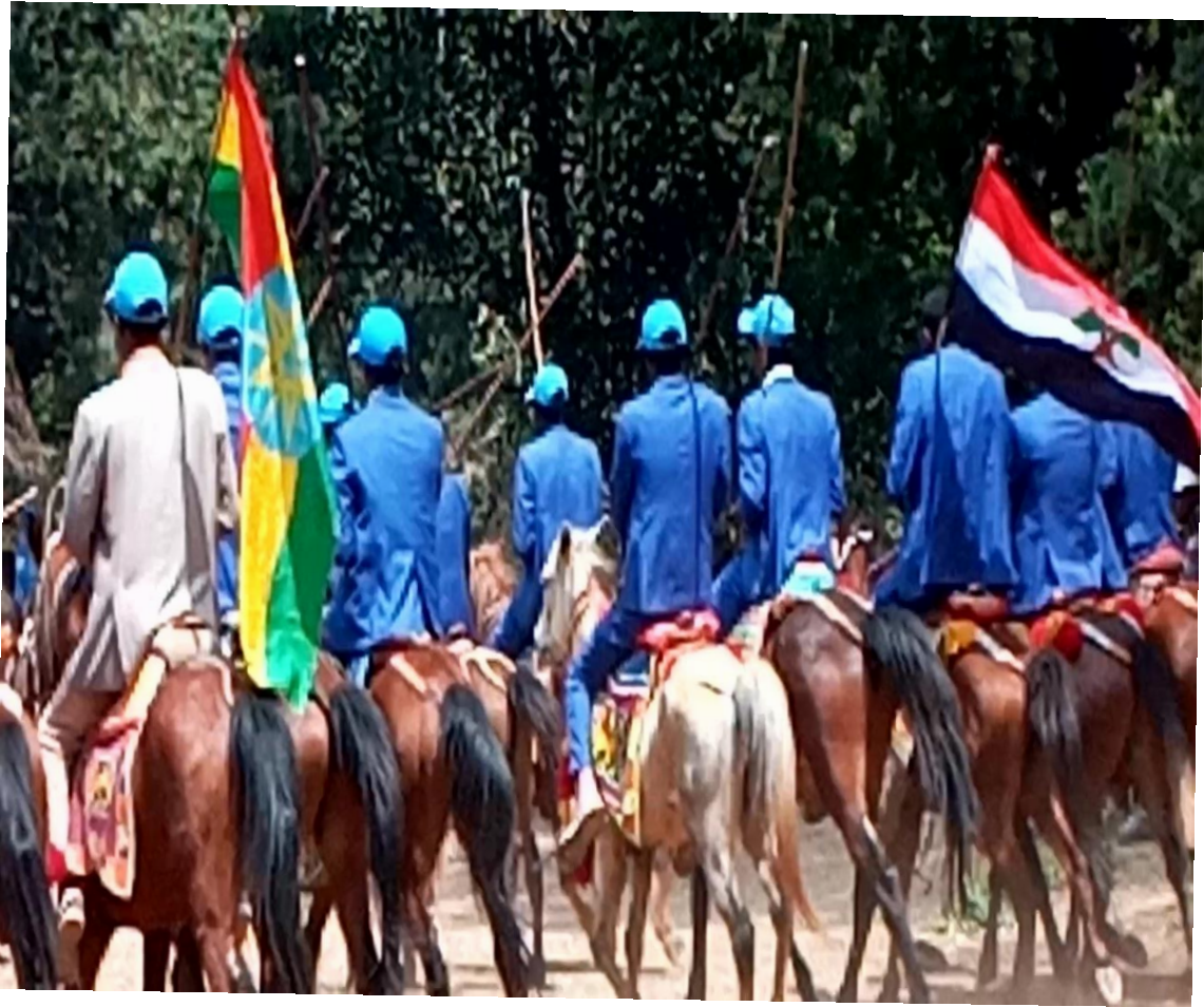
ፎቶ:13 በፈረስ ሙሾ ስያቀርቡ