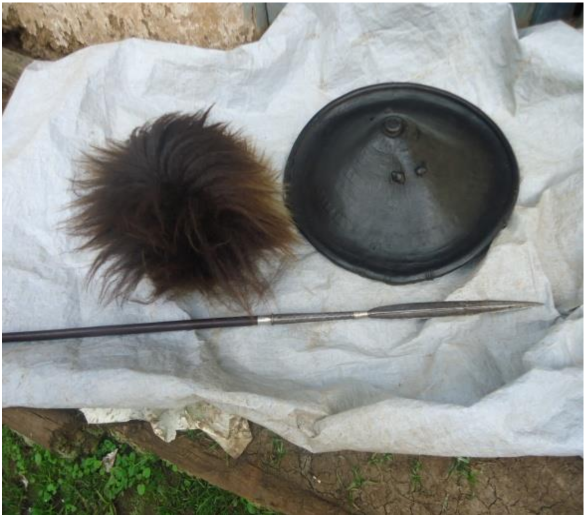
ፎቶ:7 በስርአቱ ላይ የሚያዙ ቁሶች

መልክ ያ ልጅ የሚቸን ስም ይዞ እንዲቀር ሚስቱንም እንደ ልጇ ሆኖ በህይወት ዘመኗ ያገለግላታል። እሷ ከሞተች የንብረቱ ወራሽ እሱ ነው። በዚህ ስርዓት ላይ የሚያዙ ቁሶች ራሳቸውን የቻሉ ትዕምርት አላቸው። ልጁን የወለዱ ሰዎች የራሳቸው አድርገው እንዳያስቡ የሚያደርግ ትርጉም አለው። ለምሳሌ አለንጋ ብንወስድ ወሳኔ የሚተላለፍበት ቁስ ነው። ጦር ደግሞ ከወሳኔ ወደኋላ የተመለሰ በማህበረሰቡ ዘንድ ጦሩ ወግቶ እንደሚገድል ይታመናል። አቶ ነገሱ አምዲሳ የወሊሶ ባህልና ቱርዝም የቅርስ ጥበቃ ባለሙያ (ቃ.መ.06/08/013 ወሊሶ)