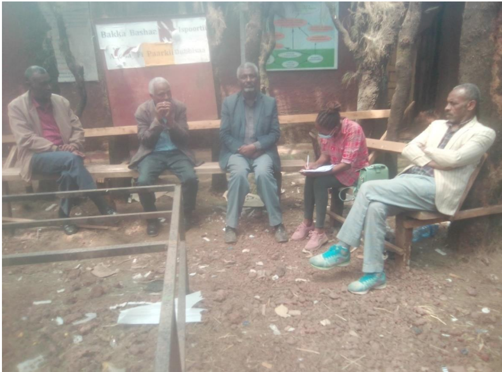
ፎቶ 1: አራቱ የወሊሶ ልጆች (ቃለ መጠይቅ 10/08/2013 ወሊሶ)

ልጆች የተወጣጡ ቡድኖችን ይጠቀማል። (የወሊሶ ከተማ አስተዳደር ከንቲባ ቢሮ ሚያዝያ 2009)።