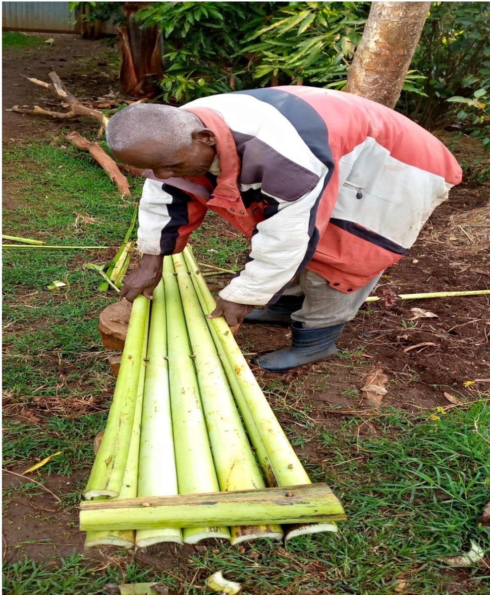
ፎቶ:6 እስከሬን የሚቀመጥበት “ተምቦሽላ”

በተዘጋጀ ትልቅ ጋቢ እስከሬኑን ከፍነው አሁንም ልምድ ያለው ሰው ከእንሰት “ተምቦሽላ” የሚሰራ እስከሬኑ የሚቆይበት በአልጋ መልክ ይሰራል።