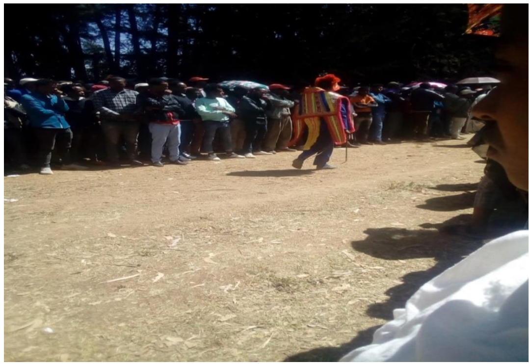
ፎቶ:11 በእግር በግል ሙሾ የሚያቀርቡ ሰዎች

ሙሾ “ቦችሳ” በወሊሶ ኦሮሞ ማህበረሰብ ከሴቶችም ሆነ ከወንዶች መካከል ተመርጠው ወዲያ ወዲህ እያሉ ሙሾ በመደርደር በተለይም “ኦፊን ኦፊን” ኢያሉ አልቅሰው በሚያስለቅሱ ሰዎች ኢየተመረ የሚፈጸም ክዋኔ ነው። በወሊሶ ኦሮሞ ማህበረሰብ በሙሾ ስርዓት (ቦችሳ) ለቀስተኞች የተለያዩ ቁሳቁሶችን (የሟች ልብስ፣ የሟች ፎቶ፣ ጋሻ፣ ጦር፣ ቀጭን ዱላና የመሳሰሉትን) በመያዝ በፈረስ ወይም በእግር በመንቀሳቀስ በግል ወይም በቡድን በመሆን በመፎከር የሟችን ጀግንነት፣ ፍህፍህነት፣ ቸርነትና ደግነት የሚገልጹበትም ነው።