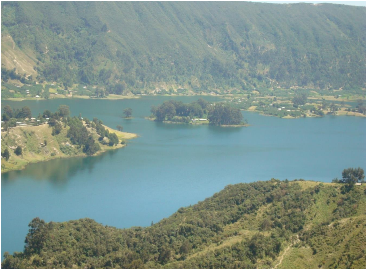
ፎቶ3: ወንጨ ሀይቅ (በአጥኝዋ)

ክረምት ከበጋ የወሃው ቅዝቃዜ፣ ጥራቱ ጀልባ ላይ ሆኖ ወደታች መሬትን ማየት የሚቻል መሆኑ እና በጋራ የተከለለ መሆኑ ውብና ማራኪ ያደርገዋል። ከሀይቁ መሃል አንድ ደሴትና ጥንታዊ የጭርቆስ ገዳም ይገኝበታል። ሀይቁ ማራኪ ከመሆኑ የተነሳ የውጭ ዜጎችና የሃገር ውስጥ ጎብኝዎች ቁጥራቸው ከቀን ወደ ቀን እየተበራከተ መጥቷል። (የወሊሶ ከተማ አስተዳደር ከንቲባ ቢሮ ሚያዝያ 2009)።