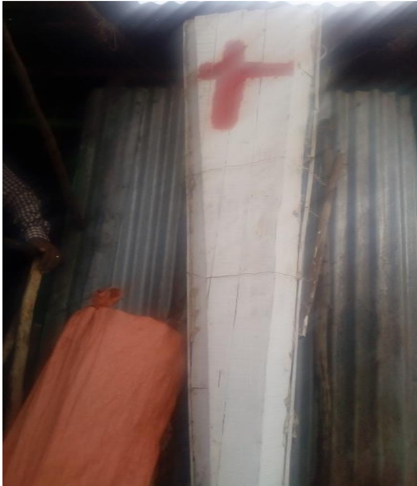
ፎቶ:5 የወሊሶ ኦሮሞ ኅሣ የሬሳ ሳጥን