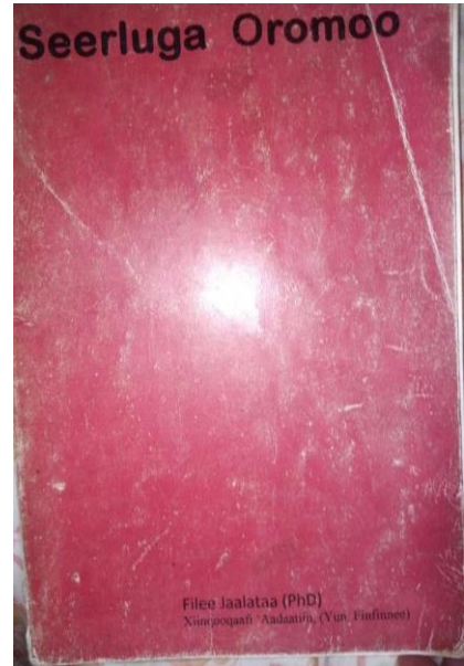
kitaaba seerluga oromoo