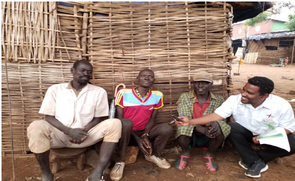
ፎቶ2:- ወንድ ተተኳሪ የቡድንን ተወያዮችን በከፊል የሚያሳይ፤