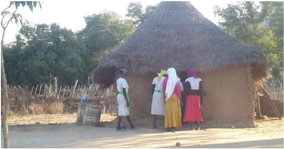
ፎቶ11:- ጓደኞቿ እንኳን ደስ አለሽ ሊሏት ከትንሿ ጎጆ ቤት ሲገቡ

መጻ ኮዋ (ትንሿ ጎጆ ቤት):- ይህች ጎጆ ቤት ምሰሶ የላትም። ምሰሶ አለመኖሩ ሙሳ አምላክ ወደዚች ጎጆ እንደማይገባና ቆሻሻና ነውር የሆኑ ነገሮችን ዐይቶ እንደማያዝን ይታመናል። ጫካ ወልዳ የመጣች እናት፣ የወር አበባ ያዩ ሴቶች፣ እንቅፋት የመታቸው፣ ሰውነታቸው የቆሸሸ፣ ላበት የሆኑ፣ ቶሎ ቶሎ ወደታች ወደላይ የሚል በሽታ የያዛቸው፣ ሳልና አክታ የሚያበዙ ወዘተ ሰዎች የሚበሉት የሚጠጡት እየቀረበላቸው ከዚች ጎጆ ቤት ይቆያሉ። «መጀመሪያ ጋህጃ እንዳየች ከዋናው መኖሪያ ቤት ወጥታ ለብቻ በተሰራች አነስተኛ ጎጆ ቤት ትገባለች። ይህን ቀድሞ ቤት ውስጥ ሲወራ፣ መንደሩ ላይ ከሷ የቀደመች ልጃገረድ ስታደርገው ታውቃለች። ትንሿ ጎጆ ቤት ምሰሶ ስለሌላት ፈጣሪ ሙሳ ገብቶ ቆሻሻና ነውር የሆኑ ነገሮችን ዐይቶ አያዝንብንም። ስለዚህ ሁሉም የጉሙዝ ማኅበረሰብ ቤት ሰርቶ ጎጆ ሲወጣ ትንሿን ጎጆ ቤት መስራት ግዴታው ነው።» (ተ.ቡ.ወ.1፣27)