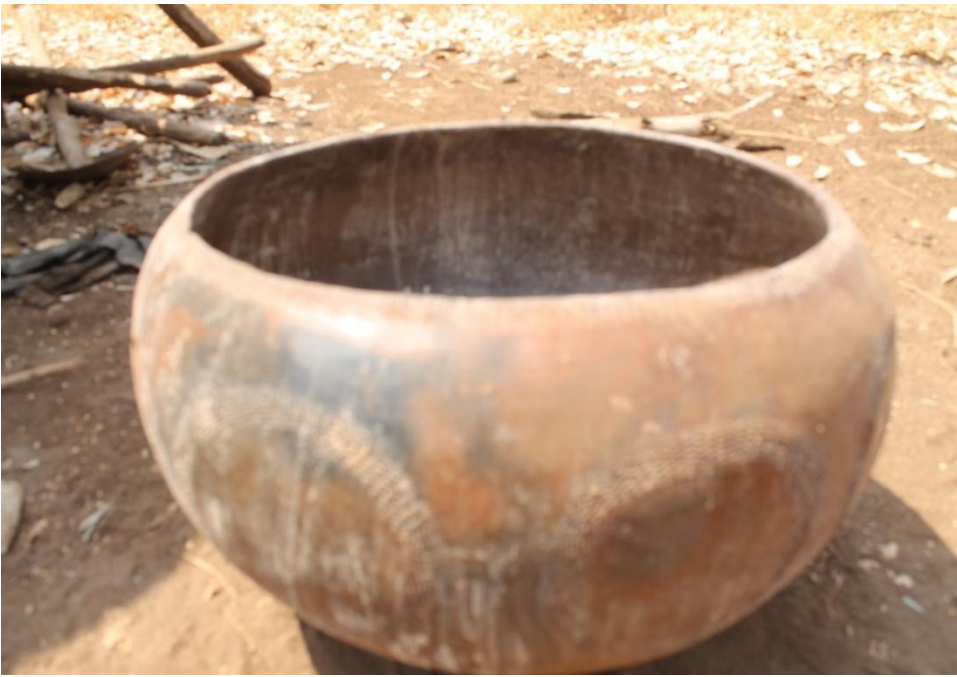
ፎቶ2:- ከቅል የተሠራ የሥርዓቱ መከወኛ ማቡኪያ፤

ፀጉራቸውን የሚስተካከሉበት ምላጭ፣ ለመመገቢያ የሚሆኑ ጥራሮች፣ ለመጠጫ የሚሆኑ ዋንጫዎችና ቅሎች፣ ለገንፎ ማገንፈያ ቶፋ፣ ለቦርዲ መጥመቂያ እንስራ፣ ለቡና ማፍያ ጀበና፣ ለወጥ መስሪያ ድስት፣ ለስጋ መጥበሻ ብረት ምጣድ፣ ለእህል መፍጫ ወፍጮ፣ ለሰሊጥና ለቡና መውቀጫ ሙቀጫ፣ ቻጋ (ቢላዋ)፣ የቡና መጠጫ ስኒ፣ የውኃ መቅጃ እንስራ እና የመሳሰሉት ሀገረሰባዊ የእጅ ሥራ የሆኑ የመከወኛ ቁሳቁሶች ሁሉ ይዘጋጃሉ። ሁሉም ሥርዓቱ በተሳለጠ መንገድ እንዲፈፀም የራሳቸው አገልግሎታዊ ፋይዳ አላቸው።