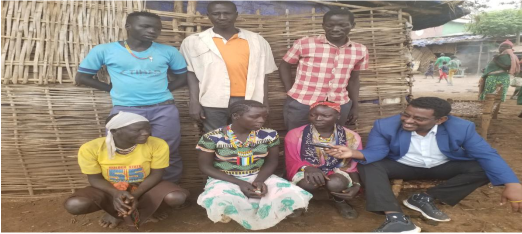
ፎቶ5:- በሥርዓቱ ክወና ላይ የተሳተፉ እና ቃለ መጠይቅ የተደረገላቸው፤