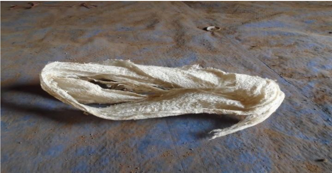
ፎቶ13:- ምጫ (ባሕላዊ የሴቶች ንፅህና መጠበቂያ)

ልጅቱ የወር አበባ የምትቀበልበት ምጫ የሚባል ከሾላ ዛፍ የሚሰራ ባሕላዊ የንጽህና መጠበቂያ ይሰጣታል። አጠቃቀሙንም ጓደኛዎ ታሳያታለች። ምሽጭም ከዚህ በፊት ጋህጃ ያዩችና የሥርዓቱን አከዋወን በተግባር የምታውቅ ልምድም የምታካፍላት፤ ስትፈራ የምታደፋፍራት ናት። ምግብ እና ውኃ ታቀርብላታለች፤ የቆሽሽ ልብዓን ታጥብላታለች። ማታ ማታ ፀሐይ ከገባ በኋላ መጸዳጃ ቤት ትወስዳታለች፤ ጋህጃ የነካውን ቆሻሻም (የመርገም ጨርቅ) መሬት ቆፍራ ትቀብረዋለች። አካ ጎኩሆ፤ አካ ጎፕያ (ፀሐይ ስትገባ፤ ፀሐይ ሳትወጣ)፡- በድግትስ ጋህጃ ክወና አንዳንዱን ክወና ፀሐይ ስትገባ፤ አንዳንዱን ክወና ፀሐይ ሳትወጣ ይከውኑታል። ሰባቱንም ቀን የወር አበባ ያየችው ልጅ እና ጓደኛዎ መጸዳጃ ቤት የሚሄዱት፤ ደም የነካውን ቆሻሻ ቆፍረው የሚቀብሩት ማታ ፀሐይ ስትገባ ወይም ሌሊት ፀሐይ ሳትወጣ ነው። ጓደኞቿን የወር አበባ አይቻለሁ ኑ እንጨፍር የምትላቸው፤ ወንዶችን እንደተኙ አመድ የሚረጫቸው እና በሰባተኛው ቀን ወንዝ ሊታጠቡ የሚሄዱት ሌሊት ወፍ ሳይንጫጫ ፀሐይ ሳትወጣ ነው። ይህም ከሰው እይታ ለመራቅ፤ ከፀሐይ ጋር በተያያዘ ከሚመጣ በሽታ ለመራቅ እንደሆነ ይነገራል። «በፀሐይ ቆሻሻ ቆፍሮ ለመቅበር ምች ያስመታል፤ ስለዚህ ማታ ቀዝቀዝ ሲል ይሻላል። ቀን ቀዝቃዛ እንኳ ቢሆን ሴቶች ልጆች ያፍራሉ። ማክበር እንጅ ማፈር፤ መሳቀቅ የለባቸውም። የጉሙዝ ሕዝብ ቀን ቀን እርሻ ወይም አደን ስለሚውል ቀን ተሰባስቦ ለመጫወት አይመቸውም። ስለዚህ ማታ ማታ ተመራጭ ነው። ወደ ወንዝ ሌሊት የሚሄዱት ግን ለመንጸት፤ በሽታም ካለ ለመዳን ነው።» (ተ.ቡ.ወ. 2፣10)