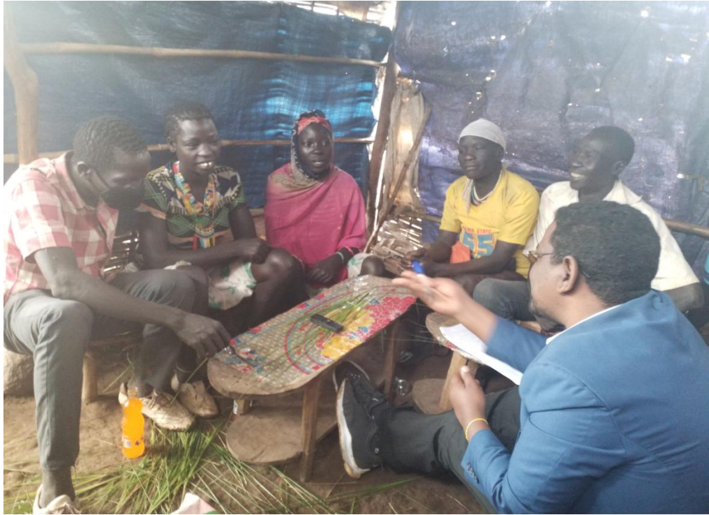
ፎቶ3:- በቃለ መጠይቅ ተሳታፊ የሆኑ ወጣቶችን በከፊል የሚያሳይ፤