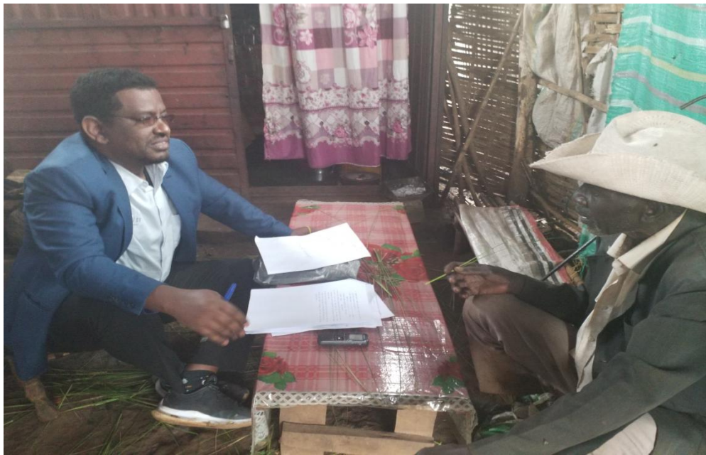
ፎቶ4:- በቃለ መጠይቅ ተሳታፊ የሆኑ ሽማግሌ የሚያሳይ፤