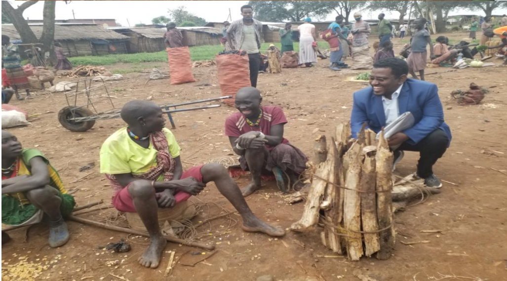
ፎቶ6:- በገበያ መሐል ቃለ መጠይቅ የተደረገላቸው፤