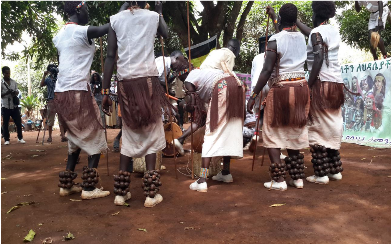
ፎቶ16:- እግራቸው ላይ የተጠመጠመው አጼጻ የሙዚቃ መሳሪያ፤

ይህ ሁሉ ሲሆን የወንዶች ሚና ማጨብጨብ፣ አንዳንዴ ከበሮ መምታት ሲደክማቸው ትተዋቸው ሔደው መተኛት ነው። በዚህ ሁሉ ቀን በየጊዜው የሚዘፈነው ዘፈን ዜማው፣ ግጥሙ የአጨፋፈር ስልቱ፣ የሙዚቃ መሳሪያው፣ ወዘተ... አንድ ዓይነት ሲሆን አቀንቃኞች ግን ሲደክማቸው ይተጋገሳሉ። ዜማው በሴቶች ቀጭን የጉሮሮና የቅንጭላት ድምጽ፣ በረጅም ትንፋሽ፣ በተደጋጋሚ <ኤ.ኤ.ኤ.ኤ.ኤ.ኤ...> በሚል አዝማች ድምፅ፣ የሚንቆረቆር ነው። ግጥሙም ተመሳሳይ ይዘት ይዞ በተደጋጋሚ የሚሳል፣ በሶስትና በአራት ቃላት ስንኝ የተዋቀረ ነው። የሙዚቃ መሳሪያቸውም ከበሮ፣ እግር ላይ የሚታሰር አጼጻ እና እርስ በርስ በማጋጨት ድምጽ የሚያወጡ እንጨቶች መሆናቸውን በምልክታ አረጋግጧልሁ።