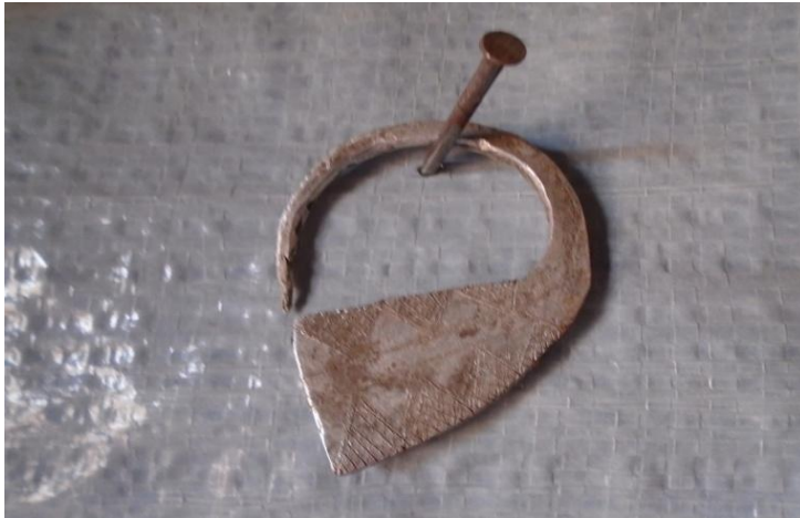
ፎቶ7:- ወጣት ሴቶች የሚያጌጡበት የጀሮ ጌጥ፣

በእጃቸው የሚያስሩት ከዱር እንስሳት ቆዳ የሚሰራ የእጅ ጌጥ (ኬቢያ)፣ ፀጉራቸውን ይከረከማሉ፣ እሽክርክሪቷ ላይ አሄጻዎ ትላጫለች።