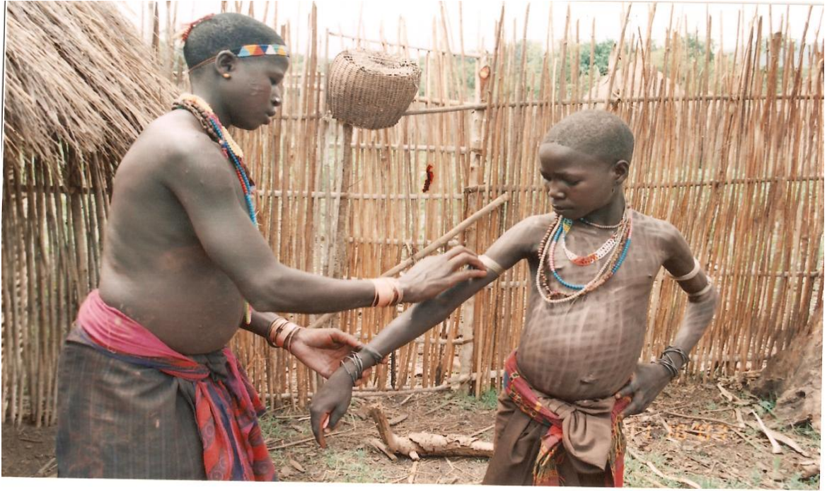
ፎቶ15:- ጋፊቃ የሚባለውን ባሕላዊ መዋቢያ ሰውነቷን ስትቀባ፤

በምልከታ እንዳረጋገጥሁት ባሕላዊ አልባላታቸውን ይለብሳሉ። በእጃቸው ላይ ከዱር እንስሳት ቆዳ የሚሰራ ኬቤያ የሚባል ጌጥ ያደርጋሉ። በክንዳቸው ላይ ደግሞ ጩቤ፣ በእግራቸው አጸፃ በማድረግ፣ መሬት እየደበደቡ ዘፈኑን የሚያደምቁበት ረዥም ዱላ፣ የምስራች መንገሪያ እርጥብ ቅጠል፣ መልካም ምኞት መግለጫ ትንሽ ቁራጭ እንጨት (ኮታ) እንዲሁም ሌሊት የተሸነፉት ወንዶች መንገድ ላይ እንዳይረብሷቸው ንፁህ አመድ ይዘው ከወንዙ እየጨፈሩ ወደ ቤት ይመለሳሉ። ጥዋት አመድ (ፀፋ) የተረጨ ወጣት ወንዶችም ሴቶች ከወንዝ ታጥበውና አምረው እየዘፈኑ ሲመለሱ ዘፈኑን በማደናቀፍ ሽንፈታቸውን ለመመለስ ጎጆው አካባቢ መንገድ ዘግተው ይጠብቋቸዋል። ነገር ግን ሴቶቹ በድብቅ በያዙት አመድ ስለሚረጩቸው ድጋሚ ያሸንፏቸዋል።