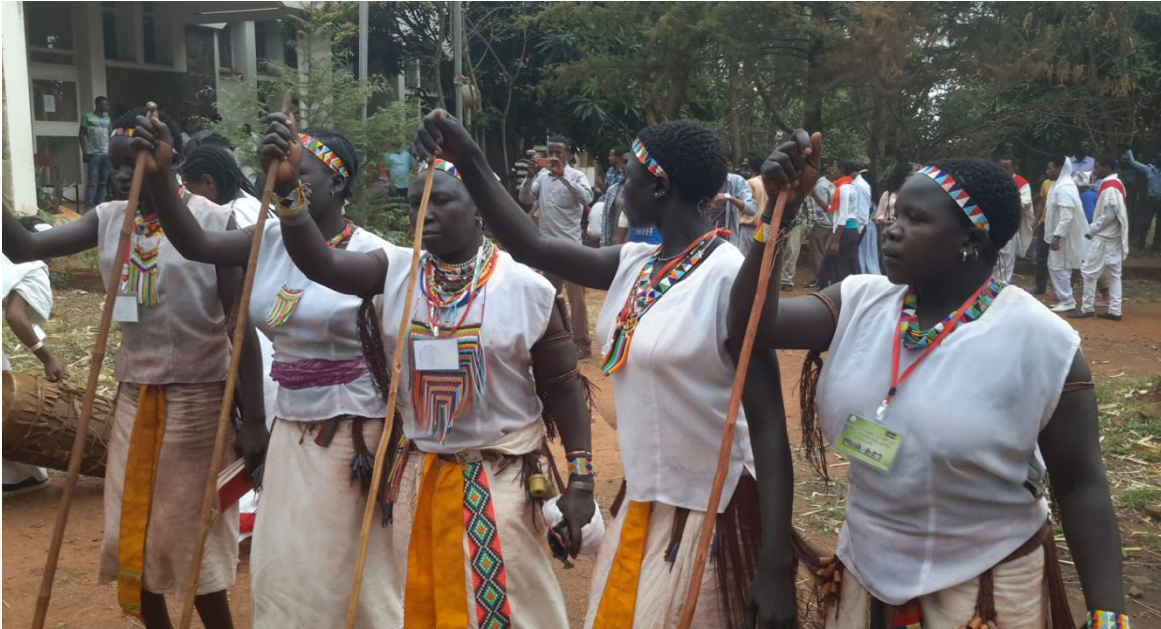
ፎቶ18:- የጉሙዝ ብሔረሰብ ሀገረሰባዊ ውዝዋዜ በጎምቦ (ዱላ):

መንዛ ሂንጃ (እርጥብ ቅጠል):- ከወንዝ የሚያመጡት እርጥብ ቅጠል የመልካም ምኞት፣ የብስራት፣ ተምሳሌት ሆኖ ትዕምርታዊ ፋይዳ ይሰጣል። «እርጥቡ ቅጠል የምስራች ነው። ልጃችን ደርሰሻል፤ እናት መሆን ትችያለሽ፤ እንኳን ደስ አለሽ፤ ቀሪ ዘመንሽ ለምለም ይሁን፤ ማለት ነው። አሁን ለምልመሻል፤ በቀጣይ ታብቢያለሽ፤ ፍሬም ታፈሪያለሽ ማለት ነው። .....» (ተ.ቡ.ው.1፣11)