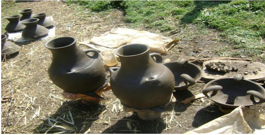
ፎቶ3:- ለሥርዓቱ መከወኛነት የሚያገለግሉ የሸክላ እቃዎች፤

ሴቶችና ወንዶች የሚራጩበት ንፁህ ዑፋ (አመድ)፣ የወር አበባ ያየችው ልጅ ስራ የምትጀምርበት እህል የምትፈጭበት ማህሻ (ወፍጮ)፣ እህል የምትወቅጥበት ሙቀጫ፣ ዱቄት የምታቦካበት ማቡኪያ፣ ወኃ የምትቀዳበት ትንሽ እንስራ እና ቡና የምታፈላበት ጀበና የመከወኛ ቁሳቁሶች ሁሉ ይዘጋጃሉ። የሚዘጋጁትም ይሁነኝ ተብሎ ለስርዓቱ መፈፀሚያነት እንዲያገለግሉ ታስቦ ቤት ውስጥ የለለው ቶሎ እንዲሟላ ይደረጋል። (ወ/ሮ ሞጋካ ንጉሴ ቃ.መ. 2፣2)