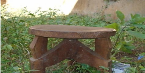
ፎቶ12:- ተጉ ጋህጃ (ወንበር)

አሄጸ በምትኖርበት ጎጆ ውስጥ የምትቀመጥበት ወንበር (ተጉ ጋህጃ) ይሰጣታል። በዚህ ወንበር ወንዶች ወይም ሌሎች ሴት ዓደኞቿ መቀመጥ አይችሉም። ተጉ ጋህጃው (የልጅቱ መቀመጫ ወንበር) የወር አበባ ላየችው ልጅ የመጀመሪያ ስጦታ ነው። ራስሽን ችለሽ ተቀመጭ፤ የተከበርሽ ሴት ነሽ፤ የሚወዱሽና የሚፈልጉሽ ሁሉ ወዳንቺ ይመጣሉ፤ ከእንግዲህ ማንም አይዳፈርሽም፤ እንደ ትልቅ ሴት እንጅ እንደ ልጅ (ሀጻን) አናይሽም፤ አንቺ መሬት ነሽ ዘራችን ሁሉ ባንቺ ላይ ፍሬውን ያፈራል እንደማለት ነው። በልጅቱ ወንበር ላይ በድፍረት ማንም አይቀመጥም። የክብሯ መገለጫ ነው። «ልጅቷ እኮ ንግስት ናት፤ ተጉ ጋህጃ የሷ ብቻ ነው፤ በኛ ልቡና የከበረና የተከበረ ስለሆነ ማንም አይቀመጥበትም። ባሌ በእኔ ተጉ ጋህጃ ላይ ተቀምጦ አያውቅም፤ ለምን ይመስልሃል? ባሌ ስለሚያከብረኝ ነው፤ መገለጫውም ይህ ነው። በኔ ተጉ ጋህጃ ላይ ከተቀመጠ ንቀቱን ወይም ጥላቻውን ገለፀ ማለት ነው። ይህን ካደረገ በኔ ብቻ ሳይሆን ፈጣሪዬም ይቀጣኛል። በልጅቱ ተጉ ጋህጃ የሚቀመጥ፤ እንኳን ወንድ፤ ሴት ዓደኛዎም ብትሆን ልጅቱ የምትረዳው እንደናቋትና ጥላቻቸውን እንደገለፁላት ነው። ይህ ደግሞ የቁጣ ምላሽ ከፈጣሪም፤ ከተጉ ጋህጃ ባለቤትም ያስከትላል። ሌሎች ዓደኞቿም ዝም አይሉም። ህፃናት እንኳ ሳያውቁ ቢቀመጡ ችግር የለውም፤ አስተምረህ ታስነሳቸዋለህ። አውቆ በድፍረት ይህን የሚያደርግ ካለ በተቃራኒው ንቀትና ጥላቻን በራሱ ላይ ያተርፋልና አያደርገውም። እኔም በእድሜዬ እንዲህ ዓይነት ደፋሮችን አላየሁም።» (ተ.ቡ.ወ.1፣15)