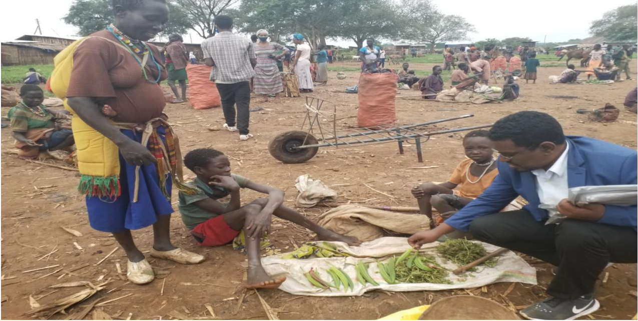
ፎቶ5:- ለምግብነት የሚያገለግሉ ዕዕዋቶች

ምግብና መጠጡ የሚዘጋጀው በአቅም ልክ እንጅ ከማን አንሼ በሚል እልህ ዕዳ ውስጥ እየተገባ አይደለም። ትንሽም ቢሆን ለሥርዓቱ መፈፀሚያ፣ ለሽማግሌዎች፣ ለዘመድ አዝማዱና ለወጣት ጓደኞቿ መሰባሰቢያ በሚሆን መጠን ይዘጋጃል። ድግስ የምትደግሱ ብዙ ነው ትንሽ? «ሴት ባለው ነው እንጅ ከለለ የት መጦ ይደገሳል። እኛኮ እንደከተማ ሰው ብድር አናውቅም። ለድግትስ ጋህጃ የሚሆን የቦርዴና የገንፎ፣ የደሮና የፍየል መቼም አይጠፋም።» (አቶ ጊሳ ዝማቻ ቃ.መ. 2፣5)