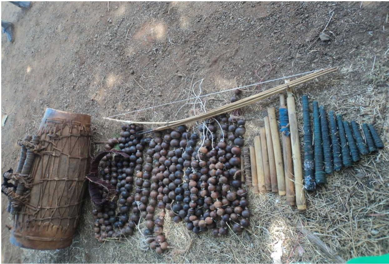
ፎቶ17:- የጉሙዝ ብሔረሰብ ሀገረሰባዊ የሙዚቃ መሳሪያዎች

በጭፈራው እና በክወናው ልምድ ያላቸው ከዋኞች ደስ በሚል በተለዩ ሳቢ ቁንጥ (Stylistic) ይከውኑታል። ጨዋታቸውን ለማየት የሚመጡ የሰፈሩ ሰዎችና ሕጻናትም በማጨብጨብና አልፎ አልፎም ጎበዞች በማለት ሞራል ይሰጧቸዋል። የተለዩ ደስ የሚያሰኝ የአከዋውን ስልት ለሚያሳዩ ሴቶችም ስማቸውን በመጥራት «ጀግና፣ ጎበዝ» እያሉ ያበራታታሉ። አጨፋፈሩንና ዜማውን የሚያበላሽ ከተገኘም «ተው አታበላሹ፣ እንደዚህ አይደለም፣ እንደዚህ ነው፤» በማለት የዜማ፣ የግጥምና የውዝዋዜ እርማት ይሰጣሉ።