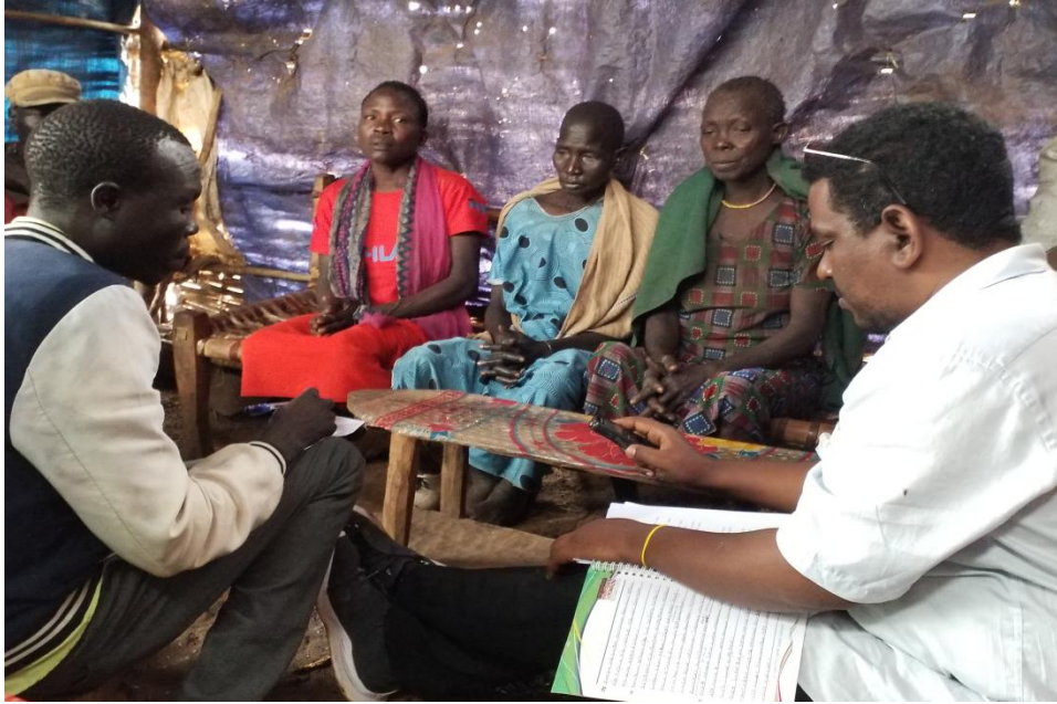
ፎቶ1:- ሴት ተተኳሪ የቡድንን ተወያዮችን በከፊል የሚያሳይ፤

❖ ማሳሰቢያ በጥናቱ ውስጥ ያሉ ፎቶዎች በሙሉ በአጥኝው የተነሱ ናቸው፡፡