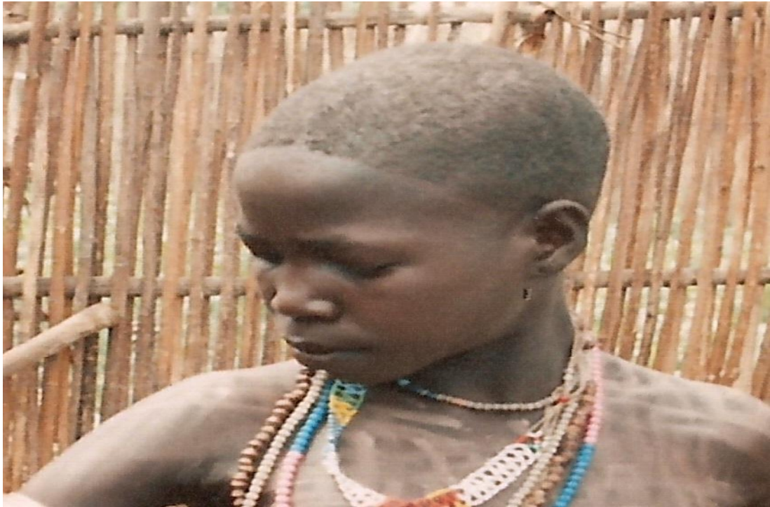
ፎቶ14. የአሄጻ አለጫጩት እና የአንገት ጌጣጌጦች

ካልተላጩች የትልቅ ሰው ምግብ፣ እንኩሮ አትበላም። ያንንም ለመብላት ስትል ትላጫለች።» (ተ.ቡ.ው.1፣13)