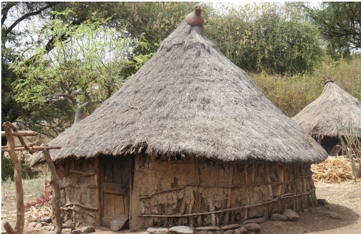
ፎቶ1:- የሥርዓቱ መከሰኛ ትልቁ ቤትና ትንሿ ጎጆ ቤት ከኋላ

ከዚህ በፊት ልጃቸው ለመጀመሪያ ጊዜ የወር አበባ ዐይታ ሥርዓቱን የፈፀሙላት እናት «... ቤተሰቡ በተለይ አባት፣ እናት እና ታላላቆች፤ ስለአጠቃላይ ዝግጅቱ፤ ስለትንሿ ጎጆ ቤት፤ ስርዓቱ ስለሚፈፀምበት ቦታ፤ የሚቀረን የለም እያሰብን እናወራለን።» (ወ/ሮ ሞጋካ ንጉሴ ቃ.መ. 2፣2) እንዳሉት የመከሰኛ ቦታ ዝግጅት ያደርጋሉ።