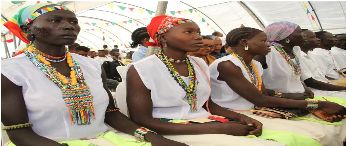
ፎቶ8:- ባሕላዊ የራስ፣ ያንገት፣ የእጅ ጌጣጌጦችና አልባሳት

ለሴት ተተኳሪ የቡድን ተወያዮች የወር አበባ ያየችው ልጅ ፀጉሯን ትስተካከለች፣ መሐል ላይም ትላጫለች ፣ ጋፈቃ ትቀባለች ተብሎ ለቀረበላቸው ጥያቄ፡- «አዎ ትላጫለች፣ በኛ በጉሙዞች ብዙ ዓይነት የፀጉር አለጫጨት አለ። የወር አበባ ያየችው ልጃገረድ የምትላጨው የብስራት ማሳያ ምልክት ነው። ዙሪያውን ክብ ቅርጽ እና መሐል እሽክርክሪቷ ላይ ትላጫለች። ይህም ጋህጃ ዐይቻለሁ፣ ለአቅመ ሔዋን ደርሻለሁ፣ ማግባትም፣ መውለድም፣ እችላለሁ ማለት ነው። ጋፈቃ የምትቀባው ደግሞ የአዲስነት ምሳሌ ነው። » (ተ.ቡ.ወ. 1፣13)