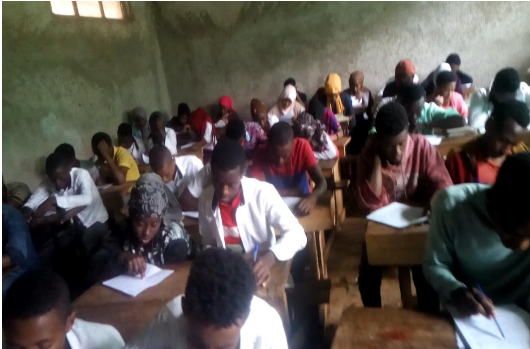
Suuraa 3. Yeroo barattoonni Mana Barumsa sadarkaa 2ffaa Haroo kutaa 9ffaa qormata fudhatan.

Akka waliigalatti, bu'aan qorannoo kana irra hubachuun kan danda'amu, dandeettiin hubannaa dubbisa barattoota barnoota Afaan Oromoo Mana Barumsa Haroo Sadarkaa 2ffaa kutaa 9ffaa gidduu-galeessaan (3.63) yoo madaalamu sadarkaa gaarii ta'e irra jiaachuu isaanii agarsiisa.