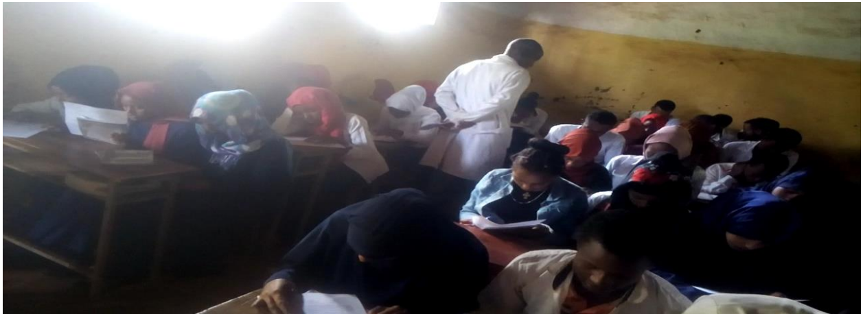
Suuraa 2. Yeroo barattoonni Mana Barumsa sadarkaa 2ffaa Yabbuu kutaa 10ffaa qormata fudhatan.

Bu'aa qorannoo kana irraa hubachuun kan danda'amu, barattoonni irra guddaan ykn baayinaan 22 (%28), 29 (%37), 21 (%27) ta'an dandeettii hubannaa dubbisa Afaan Oromootiin yeroo madaalaman sadarkaa baay'ee baay'ee gaarii, baay'ee gaarii, gaarii irra jiraachuu isaanii walduraa dubbaan agarsiisa. Haata'u malee, akkaataa bu'aan ragaalee qorannoo kanatti hubannaa dubbisa barattoota barnoota Afaan Oromoo Mana Barumsa Sadarkaa 2ffaa Yabbuu kutaa 10ffaa gidduugaleessaan (3.81) yoo madaalamu sadarkaa gaarii ta'e irratti kan argaman ta'uu mul'isa. Bu'aa qorannoo kana irraa hubachuun kan danda'amu, barattoonni barnoota Afaan Oromoo mana barumsaa sadarkaa 2ffaa Yabbuu kutaa 10ffaa walakaa ol ta'an dubbisa isaaniif dhiyaate dubbisanii hubachuu irratti fooyyee qabachuu isaanii agarsiisa.