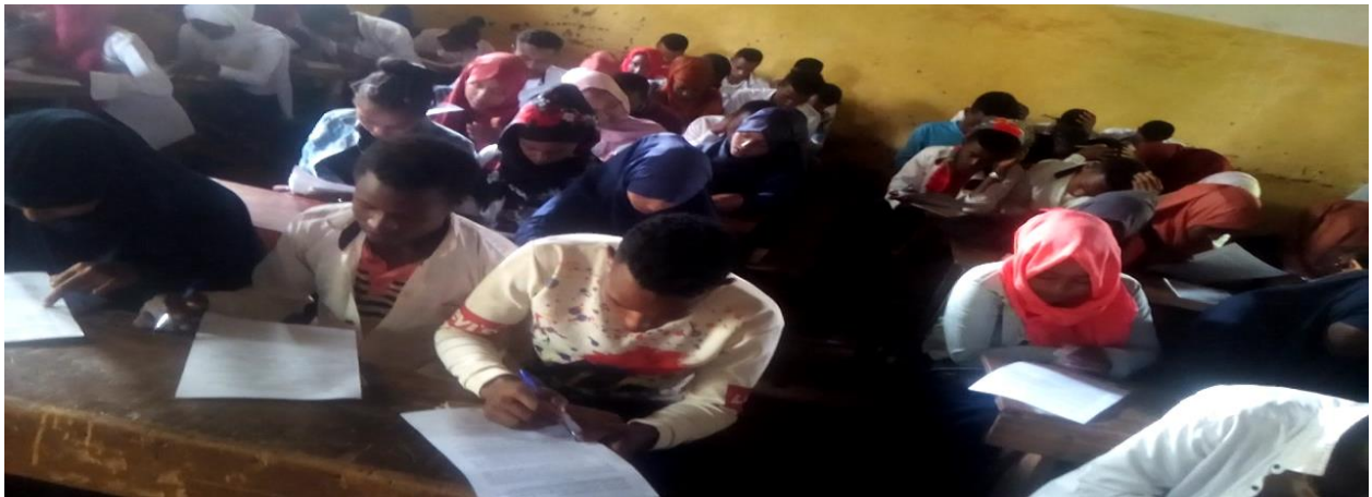
Suuraa 1. Yeroo barattoonni Mana Barumsa sadarkaa 2ffaa Yabbuu kutaa 9ffaa qormata fudhatan.

Bu'aa xiinxala ragaalee qormaata kana irraa hubachuun kan danda'amu, barattoonni irra guddaan yookaan barattoonni 47 (%45), 26 (%25), 25 (%24) ta'an hubannaa dubbisa isaaniitiin sadarkaa gaarii, baay'ee baay'ee gaarii fi baay'ee gaarii ta'e irratti argamuu isaanii walduraa dubban agarsiisa. Kana irra hubachuun kan danda'amu, barattoonni Afaan Oromoo baay'een isaanii barreeffama Afaan Oromoo dubbisaanii hubachuu danda'uu isaanii agarsiisa. Akka waliigalatti, bu'aan xiinxala ragaa hubannaa dubbisa barattoota Afaan Oromoo mana barumsa sadarkaa 2ffaa Yabbuu kutaa 9ffaa gidduu-galeessaan (3.65) yoo madaalamu sadarkaa hubannaa gaarii qabachuu isaanii mul'isa.