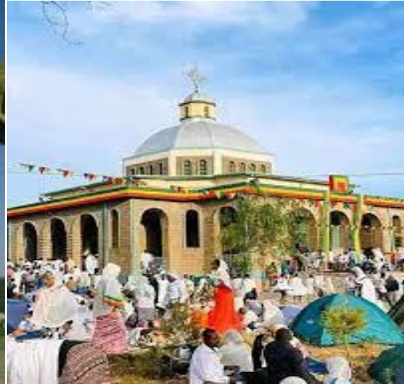
የሸንኩራ ዮሀንስ ገዳም አዲሱ ህንፃ ቤ/ክ