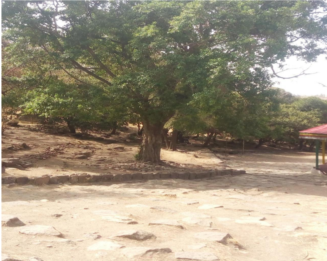
ብዙሀንን የፈወሰው የቅንጭብ ዛፍ