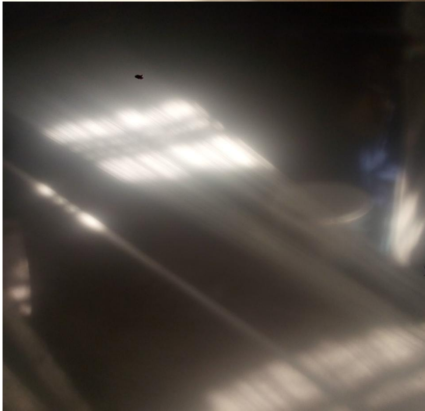
በሴቶች ገዳም የተግባር ቤቶች የሚከወኑ ስራዎች