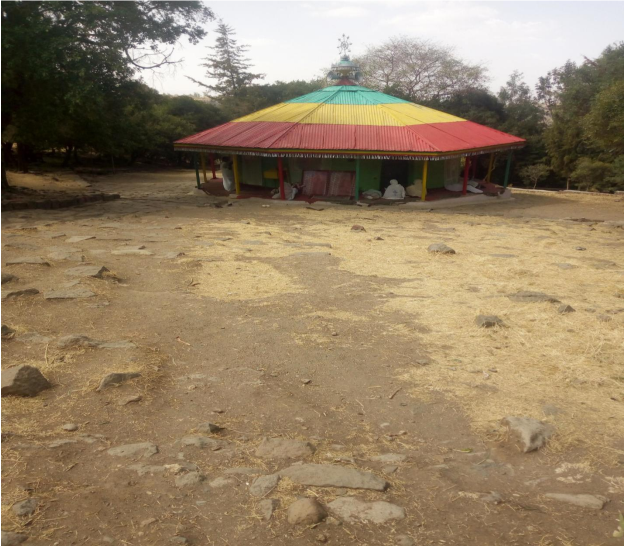
የሸንኩራ ዮሀንስ ገዳም የድርው ቤተ መቅደስ

በዚህ አይነት መንገድ ገዳሙ ለብዙ ጊዜ ከቆየ በኋላ እንደተባለው ብዙ በሽዎችን የሚፈውሰው ፤ ለምዕን የሚያነፃው ፀበል በ1954 አ.ም እነደተገኘ የገዳሙ ሊቃውንት ይገልጻሉ።ነገር ግን ፀበሉ ከመፍለቁ በፊት ከቤተ መቅደሱ ፊት ለፊት በነበሩ ሁለት ተክሎች የበለሰ እና የቅንጭብ ዛፍ ቅጠሎች ምክንያት ብዙ ሰዎች ከበሽታቸው ይፈውሱ እንደነበር በአካባቢው የሚኖሩ አዛውንት ያስረዳሉ።