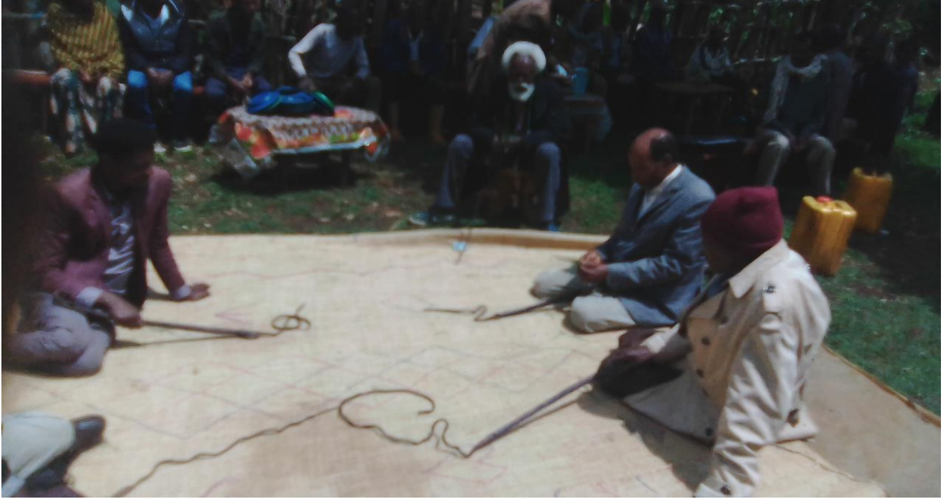
Suura:Raawwii seeraa gumaa keessatti Coqorsaan yeroo seeraa tumaanuufi araaraa raawwatanu ganda Koonnoo Lafee Arbaati qoratadhan kaafame