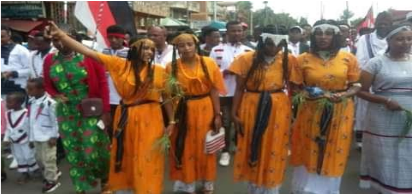
Suuraa: Daawwannaa gaafa 9/8/2014 Irreecha Arfaasaa Tulluu Horaa Ayeetuu Walisooti gaageefamee irraa qorataan kaafame