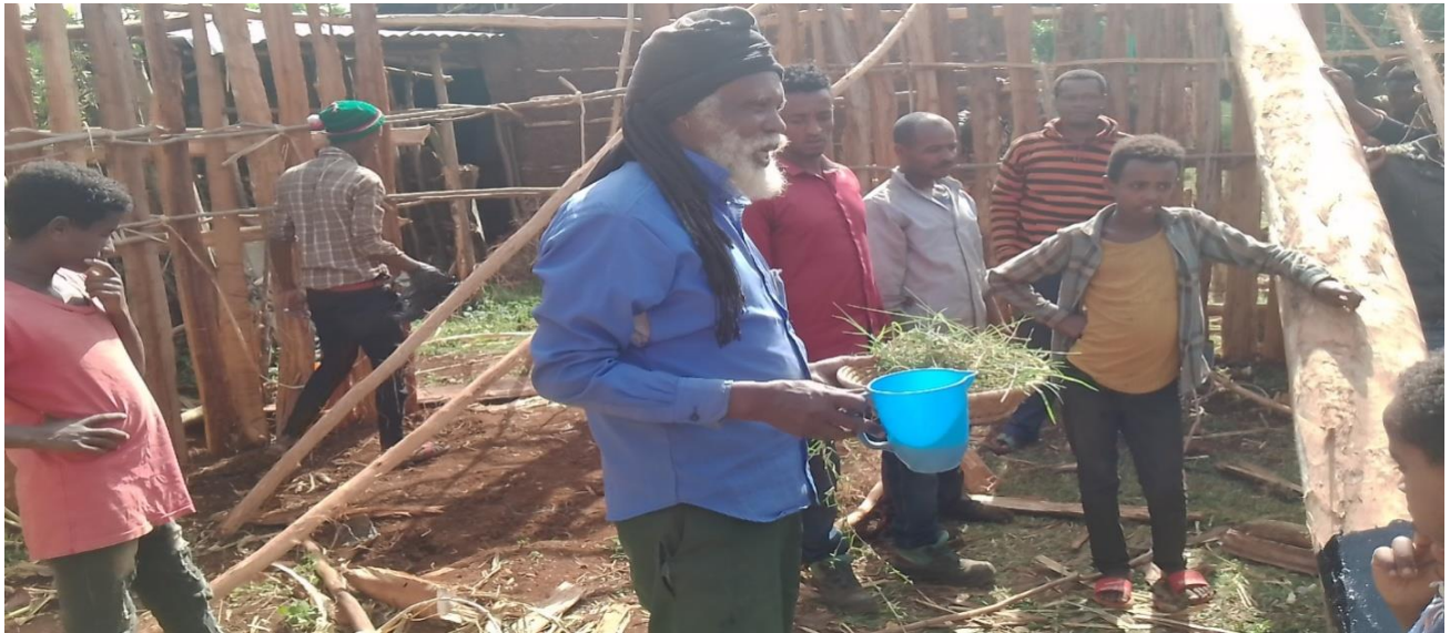
Suuraa : ijaarsaa mana cittaa aadaa daawwannaa hojii dirree irratti Coqorsa,garbuu, dhoqqee fi Aannan utubaa mana jala yeroo namu gaafa 20/9/2014 qoratadhan fuudhatame