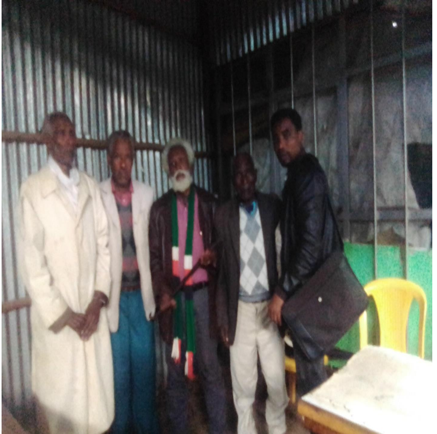
Suura:Marrii garee ganda dirree dullatiitti qoratadhan kaafame