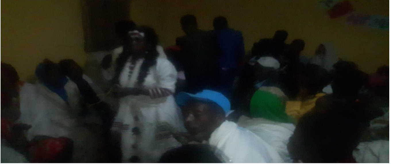
Suuraa :Saardoo kennuufi eebba fudhachuu daawwannaa cidhaa gaafa guyyaa 29/8/2014 Dur.Tashaalee Mulugeetaa fi Dar. Sinyayoo irraatti qoratadhaan kaafame.