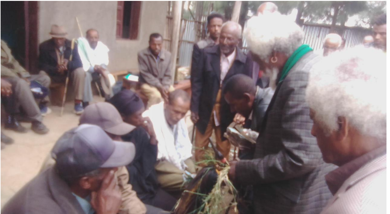
Suura :Raawwii seeraa gumaa keessatti Coqorsaan yeroo mallaqaa kennuun araaraa raawwatanu magaalaa Diilalaatti qoratadhan kaafame.