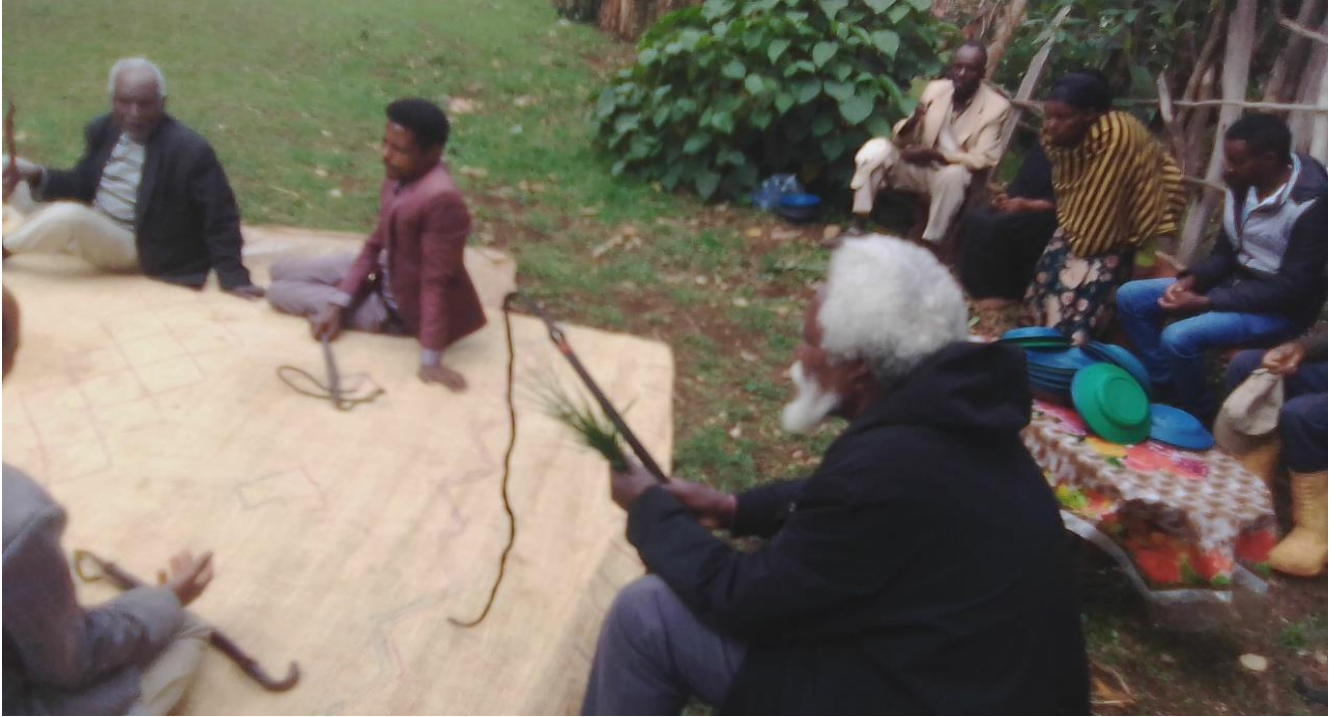
Suura :Raawwii seeraa gumaa keessatti Coqorsaan yeroo mallaqaa kennuun araaraa raawwatanu tumaanu ganda Koonnoo Lafee Arbaati qoratadhan kaafame.