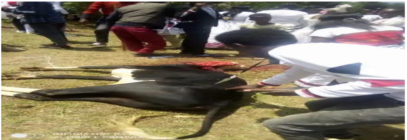
Suuraa 11: Qalma horii irreecha arfaasaa hora tulluu Ayyeetuu Walisoo gaafa guyyaa 9/8/2014 qoratadhaan kaafame

Walumaagalatti,Irreechi sirna Oromoon Coqorsaan uumaa isaa ittiin galateeffatuufi kadhatudha. Sirna irreecha birraa fi arfaasaa adeemsifamu kana keessattis kan qooda fudhaattanii fi hirmaatan immoo abbooti gadaa,haadha siinqee,hordofoonii amantaa waaqeffannaa fi fooleen addadurummaan kan qooda fudhattaan yoo ta'u,dargaggoonii,shamarraan Oromoo fi sabafi sablammoon garaagaraa yoomessaa sirnichii gaggeeffamu keessatti Coqorsaa qabatani hirmaanaa ho'aan kan hirmaatanu ta'uu ragaan daawwannoo irraa argame ni ibsa.Kanaafuu,sirna irreecha keessattii Coqorsii wantoota kenna waaqayyoon bilisaan dhala namaatiif heddu kenne keessaa tokko ta'ee,Coqorsi hawaasa Oromoo walisoo biraatti mallattummaa galateeffana,mallattummaaaraaraa,mallattummaanageenyaa,mallattummaakadhannaa,mallattum maaaangessuuyknguddummaaWaaqaa,mallattummaa,hormaataafimallattummaa,badhaadhinna,m allattummaa jabinaa agarsiisaan qabu.Dabalataaniis,tulluun immoon mallattummaa bonaafi qobummaa agarsiisaan qabachuu isaa bu'aan qorannoo armaan olii addeesseera.