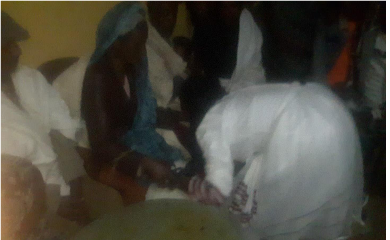
Suuraa :Saardoo kennuufi eebba fudhachuu daawwannaa cidhaa gaafa guyyaa 29/8/2014 Dur.Tashaalee Mulugeetaa fi Dar. Sinyayoo irraatti qoratadhaan kaafame.