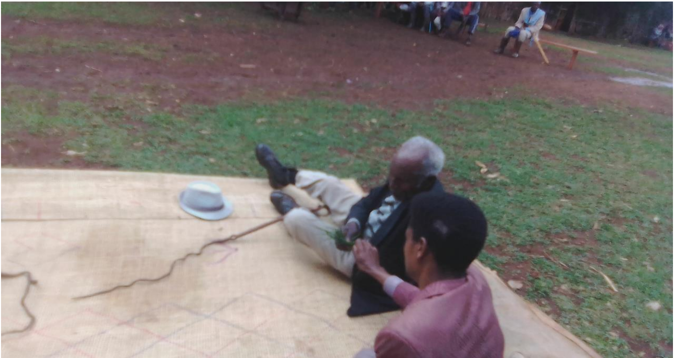
Suura :Guyyaa harka dhiqannaa yeroo seeraa tumaanu ganda Koonnoo Lafee Arbaati qoratadhan kaafame