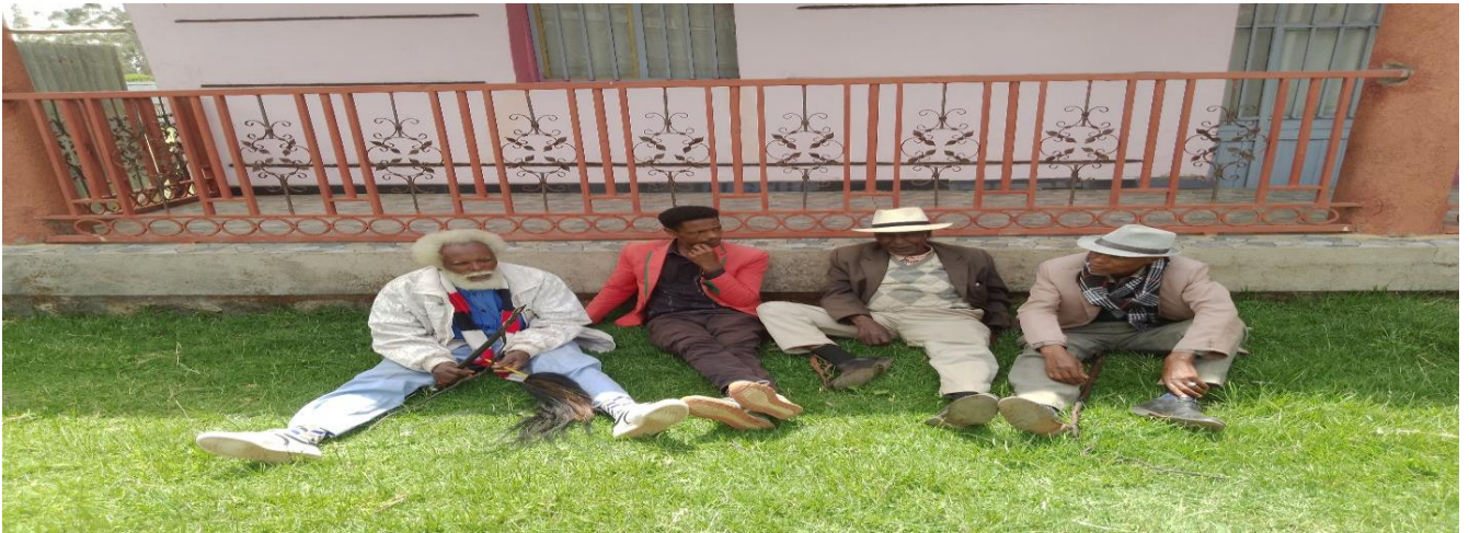
Suura 6: Yeroo jiidha irraa taa'anii gumaa muraan gaafa guyyaa 8/9/2014 qoratan kaafame

daawwannaa irraa argame ni addeessa. Haala kanaan erga qorataaniin booda guyyaa gumaa muraan qarshii murteefamee keessaa mallaqaa qabaneessa jedhanii qarshii 30,000(kuma soddoma) yeroo kennaan dursa Coqorsa kennaanii qarshii kennamus jilbaa abbaa dhibbaa namni jalaa du'ee irratti Coqorsaa kaa'uun geessaanii kanfalanni. Itti aansuun guyyaa mallaqaa hafee warri gumaa baasanu fidaanii beellamachuun Coqorsa harkaati qabatani jiraaniin eebbifachuun gumaa muruu guyyaa sana goolaban. Kun immoon mallattummaa qabaneessuufi mallattummaa eebba qaba jechuun ibsu.