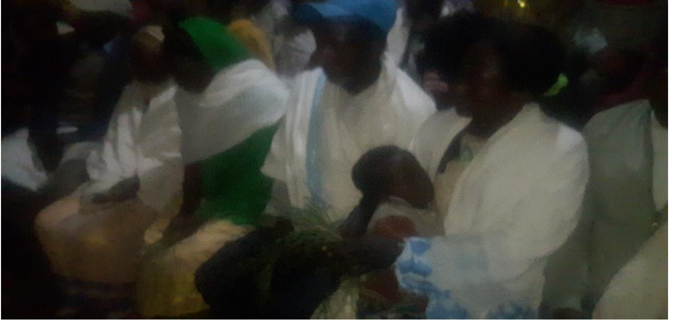
Suuraa :Saardoo kennuufi eebba fudhachuu daawwannaa cidhaa gaafa guyyaa 29/8/2014 Dur.Tashaalee Mulugeetaa fi Dar. Sinyayoo irraatti qoratadhaan kaafame.