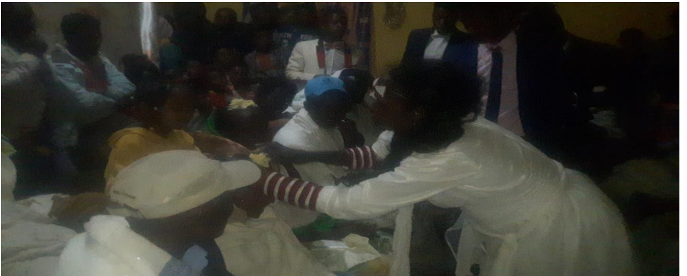
Suuraa 14: Sirna muudaa dhadhaa daawwannaa mulli irraatti qoratadhaan kaafame