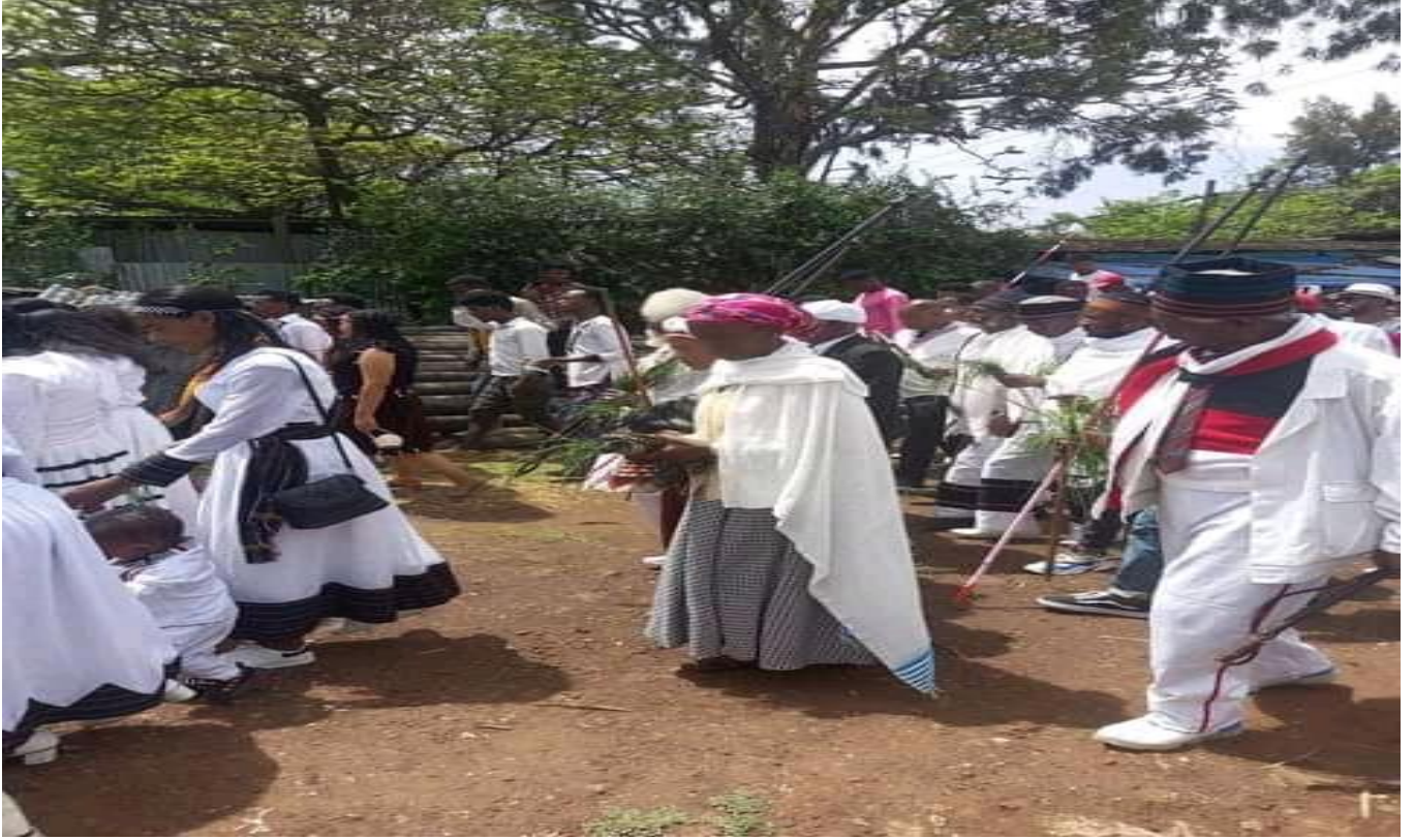
Suuraa: Daawwannaa gaafa 9/8/2014 Irreecha Arfaasaa Tulluu Horaa Ayeetuu Walisooti gaageefamee irraa qorataan kaafame.