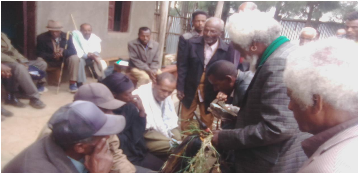
Suura 1:Yeroo Gumaa muraanii qarshii kanfalchiisaan qorataan kaafame