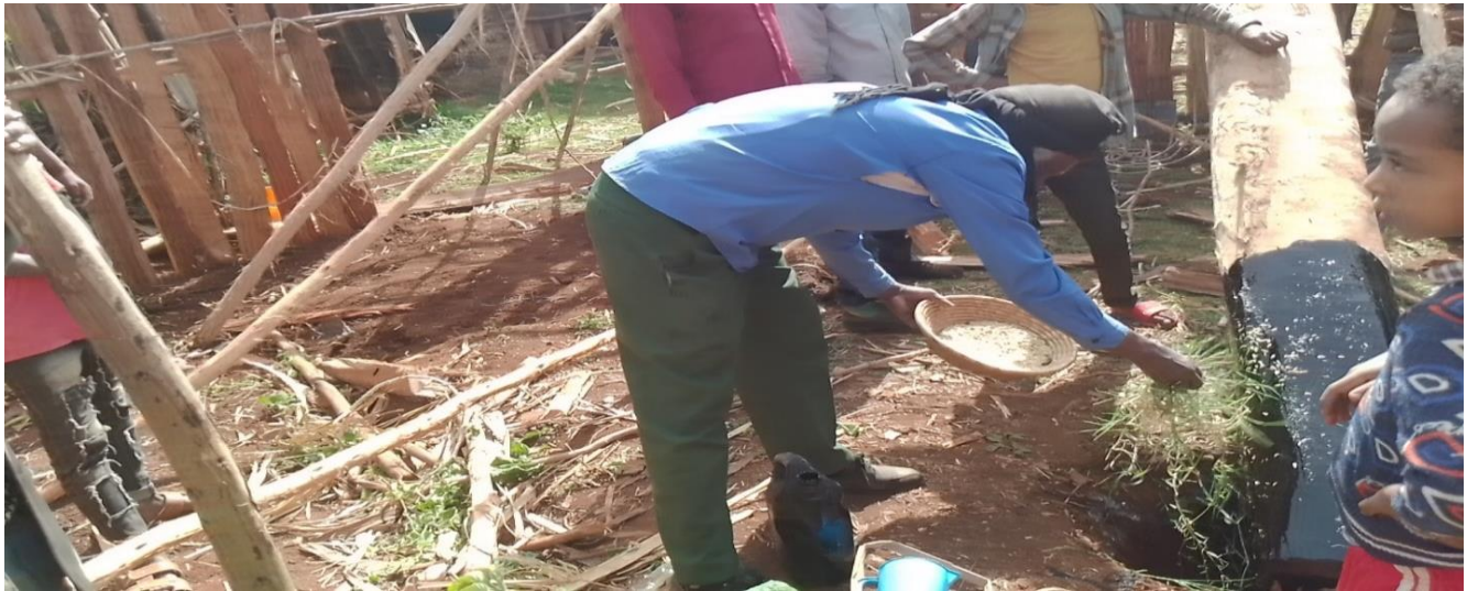
Suuraa 5: ijaarsaa mana cittaa aadaa daawwannaa hojii dirree irratti Coqorsa, garbuu, dhoqqee fi Aannan utubaa mana jala yeroo namu gaafa 20/9/2014 qoratadhan fuudhatame