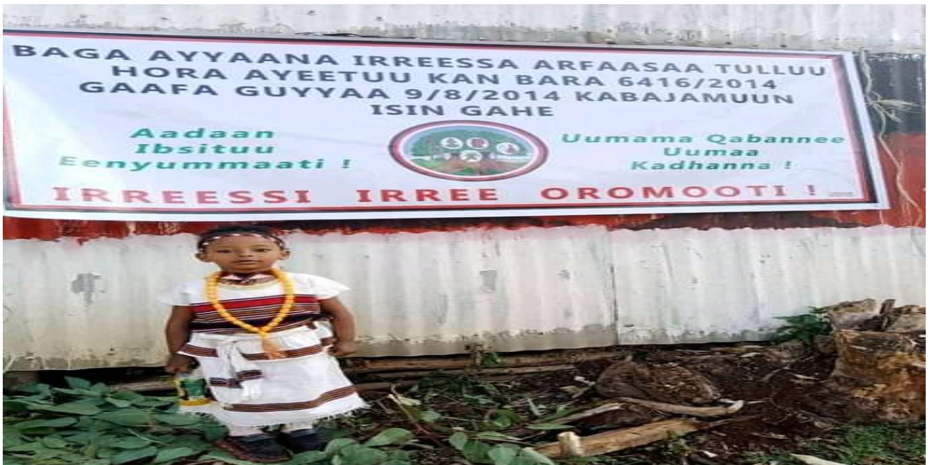
Suuraa: Daawwannaa gaafa 9/8/2014 Irreecha Arfaasaa Tulluu Horaa Ayeetuu Walisooti gaageefamee irraa qorataan kaafame.