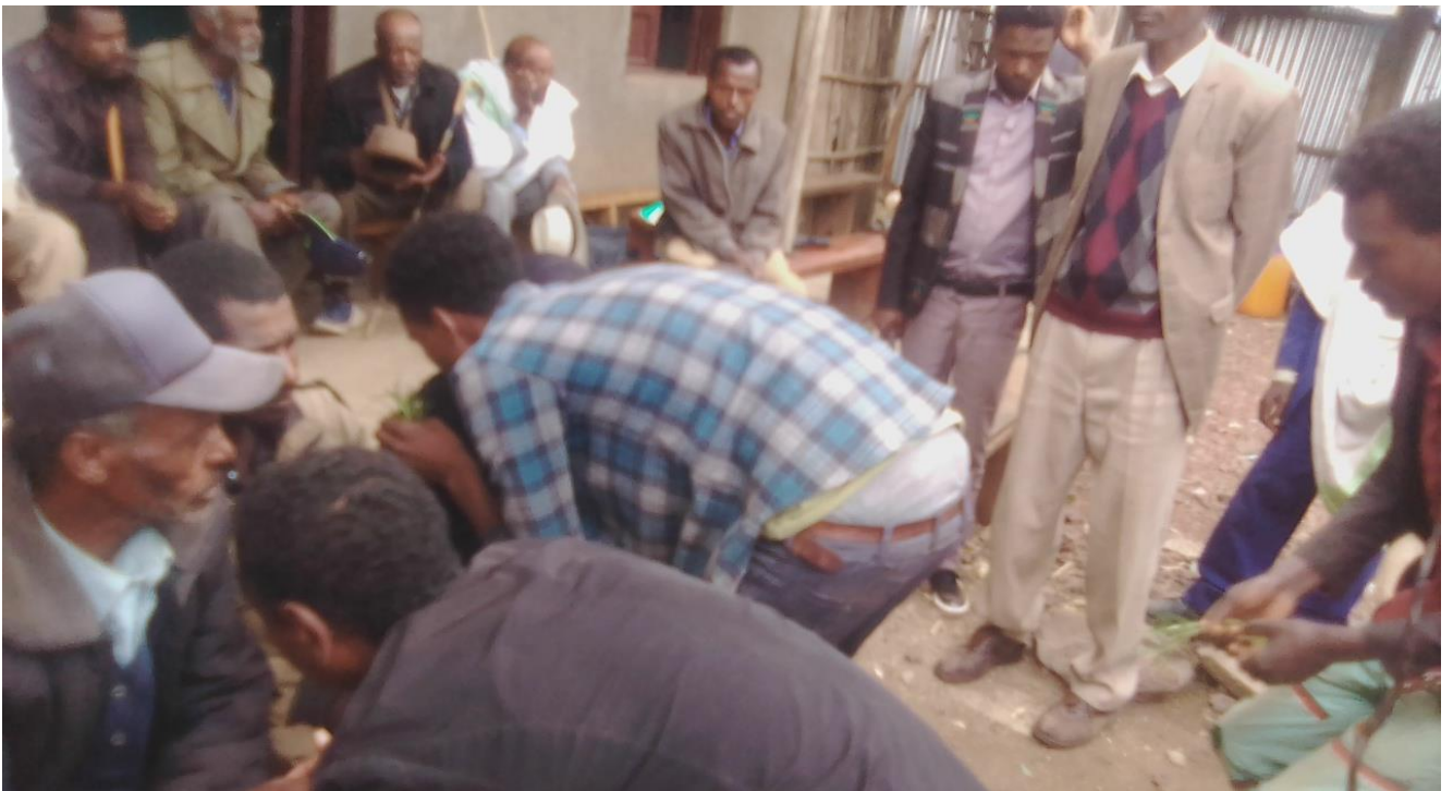
Suura:Raawwii seeraa gumaa keessatti Coqorsaan yeroo araaraa raawwatanu magaalaa Diilalaatti qoratadhan kaafame.