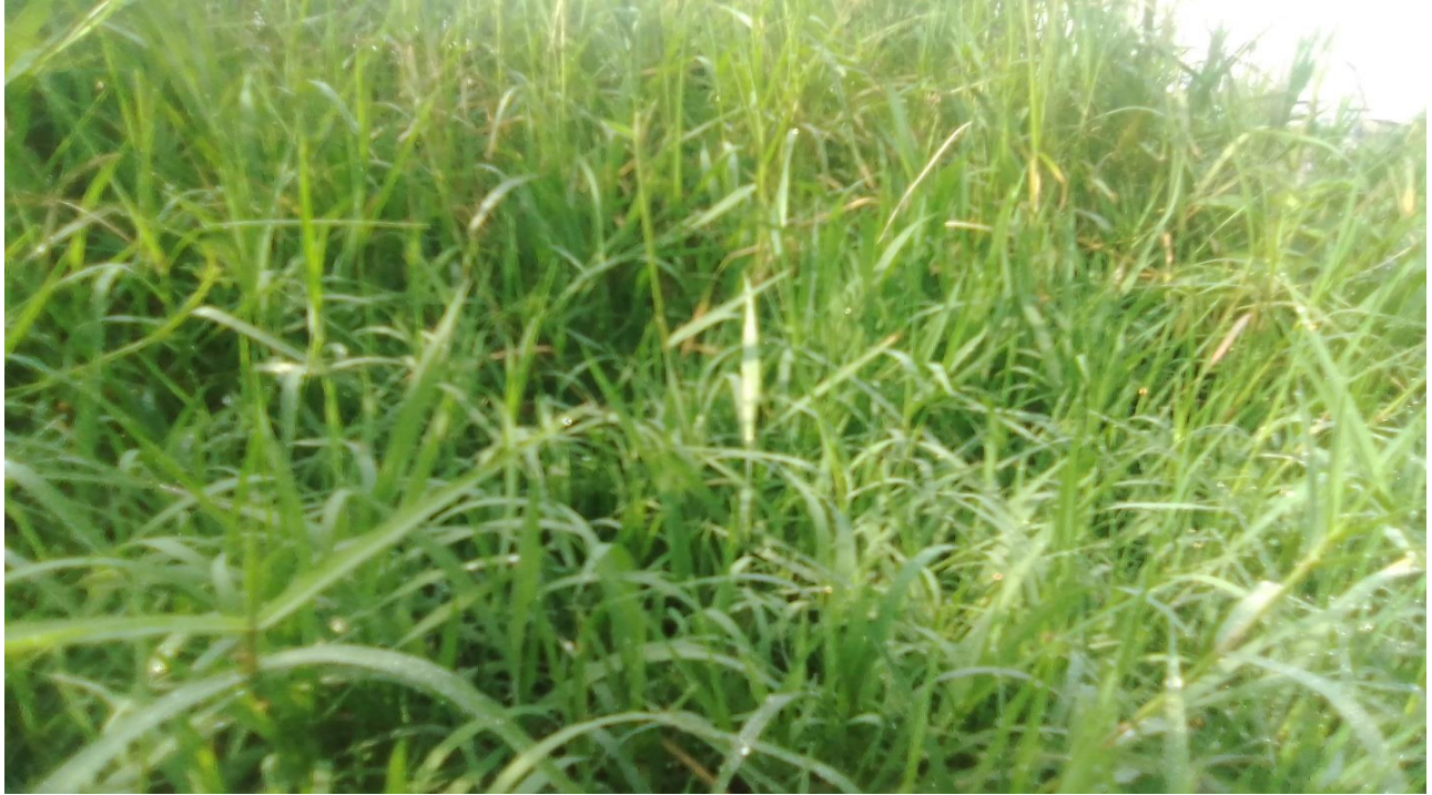
Suura 12:Suuraa sardoo yeroo qorannoo qoratadhaan kaafame

Gaanaa) tti,Saardoon jiloota adda addaa keessatti mallattummaa garaagaraa qabachuu isaa ibsu.“Saardoon Garaa-Lafeessaa akka haadhaati.Saardoon jilbaa irraa harka qaba,Saardoon gaafa buttaa qalaan qabatu.Kanaafuu, mallattummaa garaa lafuummaafi haadha qaba jechuun addeessuu.