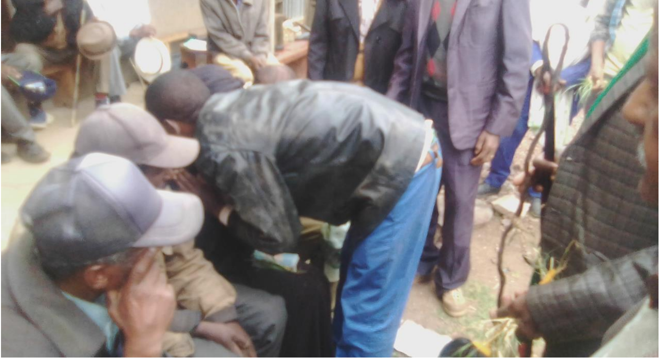
Suura:Raawwii seeraa gumaa keessatti Coqorsaan yeroo araaraa raawwatanu qoratadhan magaalaa Diilalaatti kaafame.