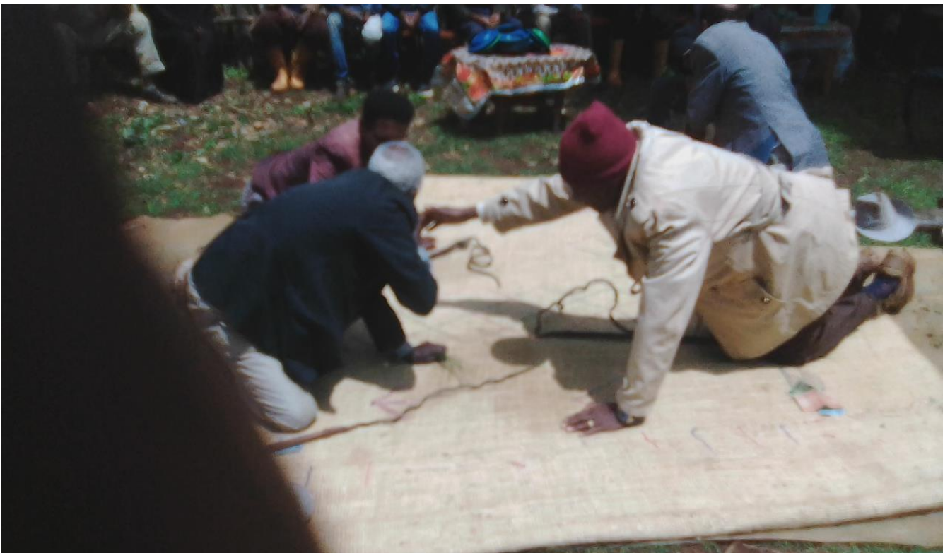
Suura:Raawwii seeraa gumaa keessatti Coqorsaan yeroo seeraa tumaanuufi araaraa raawwatanu ganda Koonnoo Lafee Arbaati qoratadhan kaafame