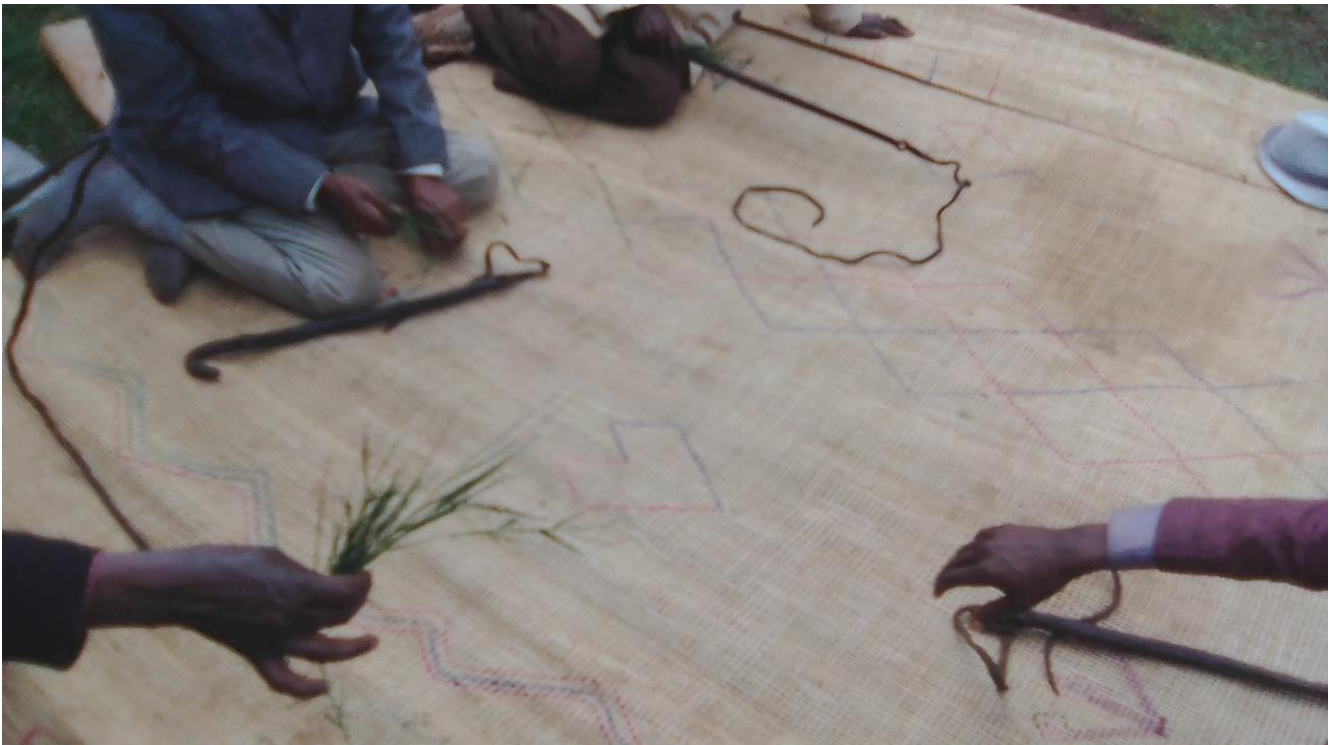
Suura :Guyyaa harka dhiqannaa yeroo seeraa tumaanu ganda Koonnoo Lafee Arbaati qoratadhan kaafame