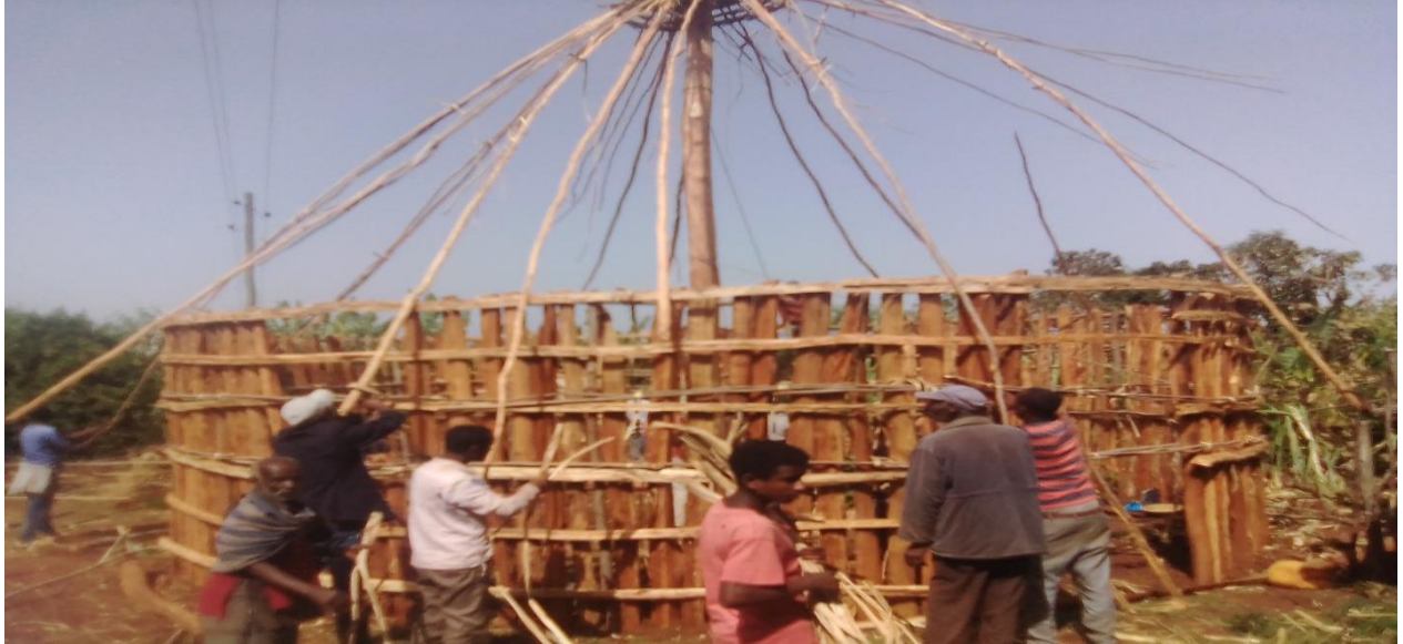
Suuraa 7: ijaarsaa mana cittaa aadaa daawwannaa hojii dirree irratti Coqorsa,garbuu, dhoqqee fi Aannan utubaa mana jala yeroo namu gaafa 20/9/2014 qoratadhan fuudhatame