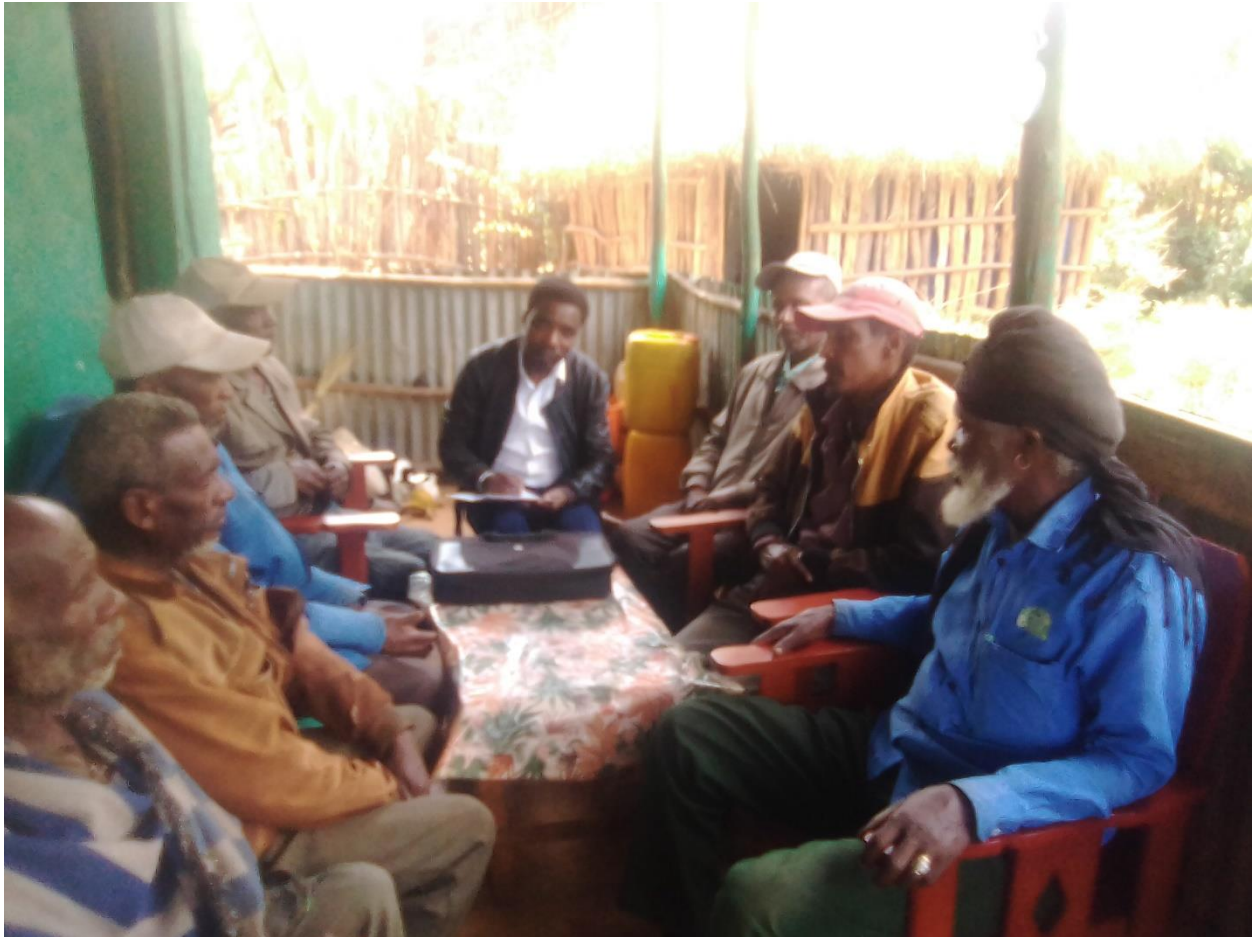
Suura 13: Marii garee gaafa guyyaa 20/9/2014Aanaa Walisoo ganda Adaamii Gootuuti dhimma mallattummaa Saardoottiif mariiyyatame irraa kan fudhatame

bahamu hubachuun danda'ameera.Kana jechuunis hawaasni Oromoo Walisoo Liiban Saardoo akka waan jiidhaafi raawwii cee'umsaa sadarkaa tokko ittiin raawwachuuf dhimma akka ittiin bahuuti ilaala.Jiidhi immoon akka hawaasa Oromoo Walisooti mallattummaa lubbuu qaba.Kanaafuu,Oromoon naannoo qoranoon kun gaggeeffame jiru jireenya isaa keessatti bakka guddaa kennuun erga ittiin dhimma bahuu jalqabee yeroo dheeraa tureera.Kunis,duudhaalee hawaasaa,Amantaa fi diinagdee gaggeeffamu keessatti walitti hidhiinsa jabaaf fi mallattummaa adda adda qabaachuu isaa qorannoo qoratame irraa hubatameera.Kanaafuu,Saardoon jireenya hawaasummaa cimsuu keessatti,duudhaalee fi aadaa garaagaraa Oromoon Walisoo Liiban gaggeeffatu keessatti akkaataa qabiyyee isaanittiin mallattummaa fi walitti hidhiinsa qabu.