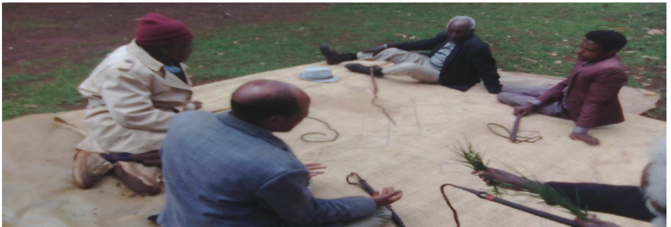
Suura 10: Guyyaa harka dhiqannaa yeroo seeraa tumaanu ganda Koonnoo Lafee Arbaati qoratadhan kaafame