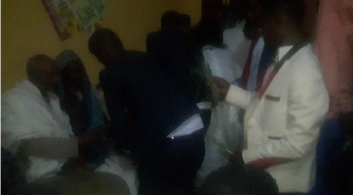
Suuraa :Saardoo kennuufi eebba fudhachuu daawwannaa cidhaa gaafa guyyaa 29/8/2014 Dur.Tashaalee Mulugeetaa fi Dar. Sinyayoo irraatti qoratadhaan kaafame.