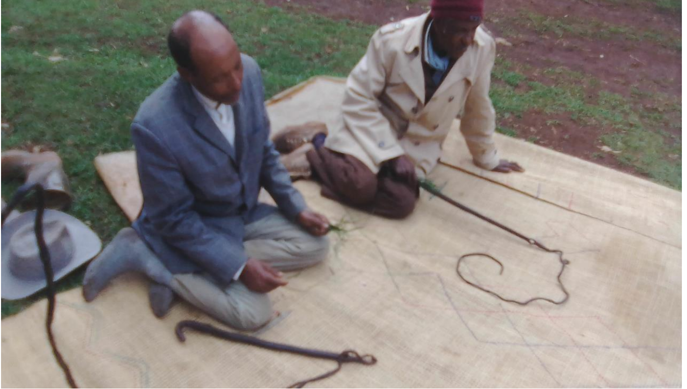
Suura: Raawwii seeraa gumaa keessatti Coqorsaan yeroo seeraa tumaanuufi araaraa raawwatanu ganda Koonnoo Lafee Arbaati qoratadhan kaafame