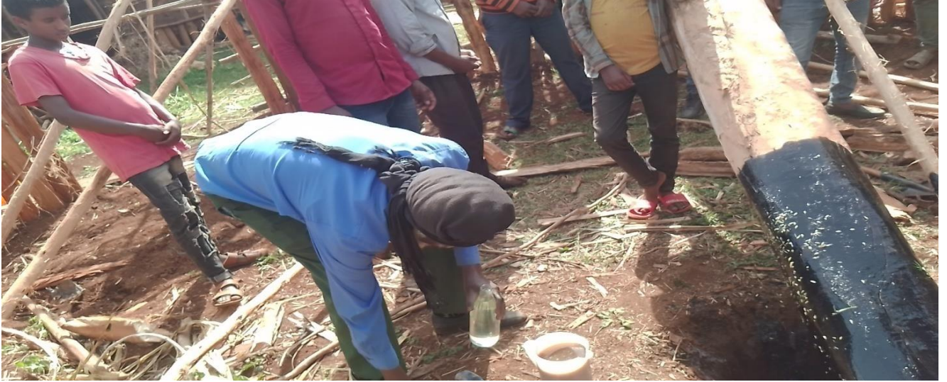
Suuraa : ijaarsaa mana cittaa aadaa daawwannaa hojii dirree irratti Coqorsa,garbuu, dhoqqee fi Aannan utubaa mana jala yeroo namu gaafa 20/9/2014 qoratadhan fuudhatame