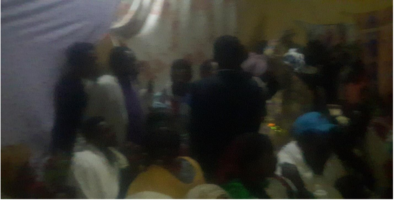
Suura :Saardoo kennuufi eebba fudhachuu daawwannaa cidhaa gaafa guyyaa 29/8/2014 Dur.Tashaalee Mulugeetaa fi Dar. Sinyayoo irraatti qoratadhaan kaafame