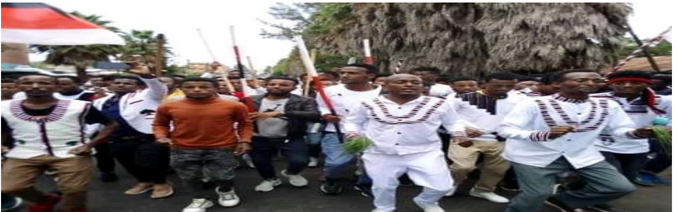
Suuraa: Irreecha Arfaasaa Tulluu Horaa Ayeetuu Walisooti gaaggeefamee irraa qorataan kaafame