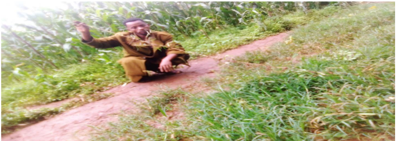
Suuraa 4: Suuraa Coqorsaa yeroo qorannoo qoratadhaan kaafame

Walumaagalat, Coqorsi wantoota uumamaa waaqaa ta'aan keessaa tokko ta'ee falasamaa hawaasichi qabu, karaa walitti hidhiinsa aadaa, duudhaa fi amantaa hawaasa Oromoo naannoo qorannoon kun gaggeeffamu jiruutiin wanta jabaawaa waaqaa irraa kadhatanii argachuuf fedhaniif uumaa ittiin kadhachuufi jiloota aadaa fi amantaa ittiin gaggeeffachuuf hawaasichi waan faayadamuuf, wantoota uumamaa Oromoon jiloota garaagaraa keessatti dhimma bahu keessaa isa tokko ta'ee bakka bu'uun, mallattummaa qabun eenyummaa hawaasa sana ibsa.