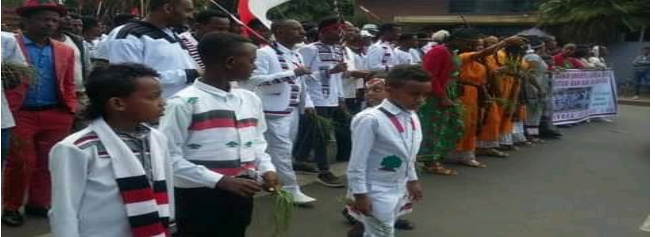
Suuraa: Daawwannaa gaafa 9/8/2014 Irreecha Arfaasaa Tulluu Horaa Ayeetuu Walisooti gaaggeefamee irraa qorataan kaafame.