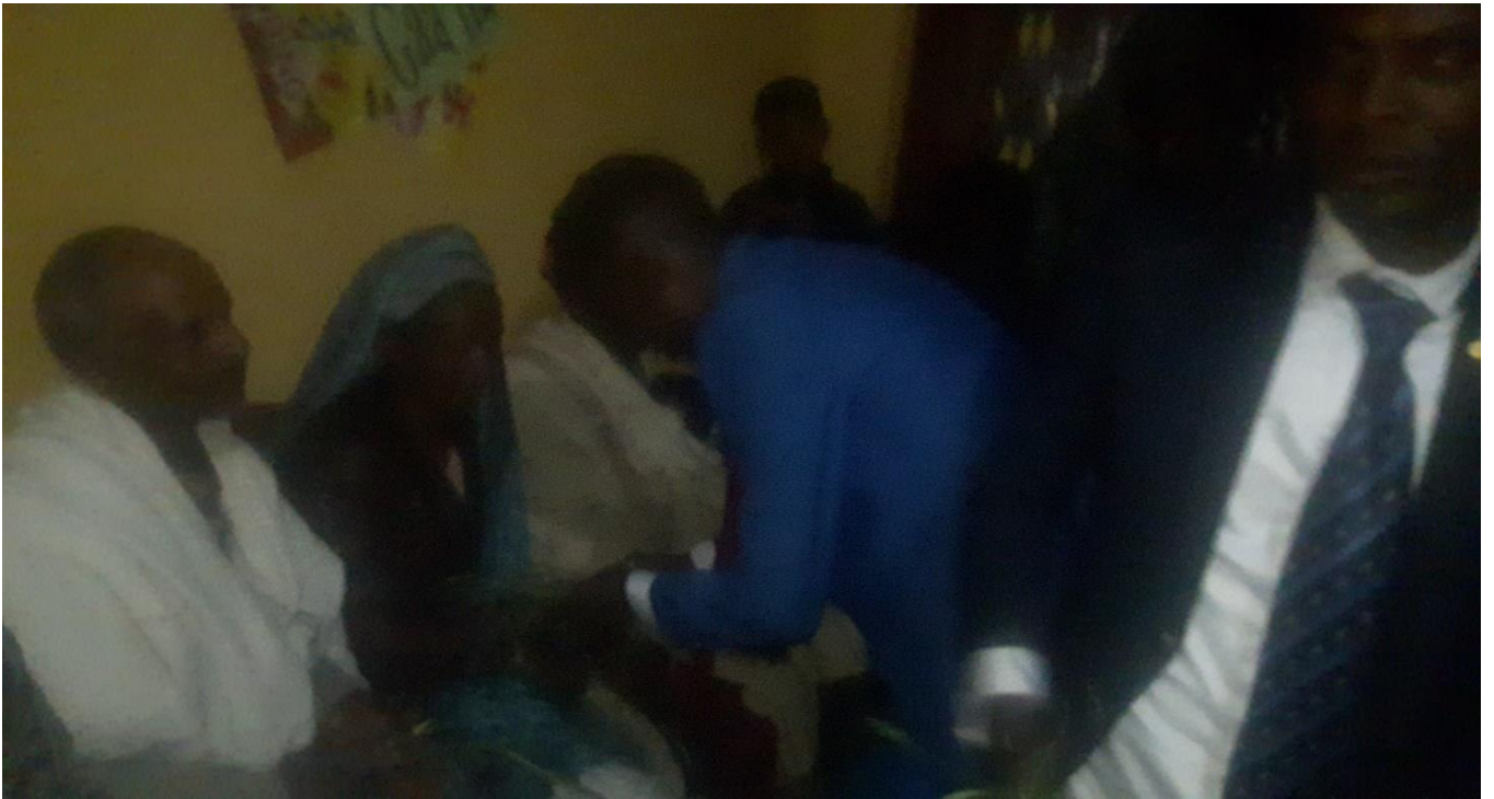
Suuraa :Saardoo kennuufi eebba fudhachuu daawwannaa cidhaa gaafa guyyaa 29/8/2014 Dur.Tashaalee Mulugeetaa fi Dar. Sinyayoo irraatti qoratadhaan kaafame.