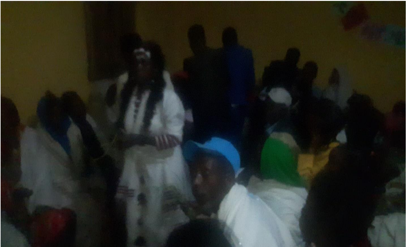
Suuraa :Saardoo kennuufi eebba fudhachuu daawwannaa cidhaa gaafa guyyaa 29/8/2014 Dur.Tashaalee Mulugeetaa fi Dar. Sinyayoo irraatti qoratadhaan kaafame.