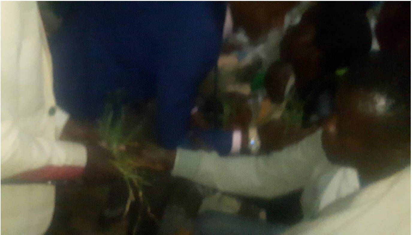
Suura :Saardoo kennuufi eebba fudhachuu daawwannaa cidhaa gaafa guyyaa 29/8/2014 Dur.Tashaalee Mulugeetaa fi Dar. Sinyayoo irraatti qoratadhaan kaafame