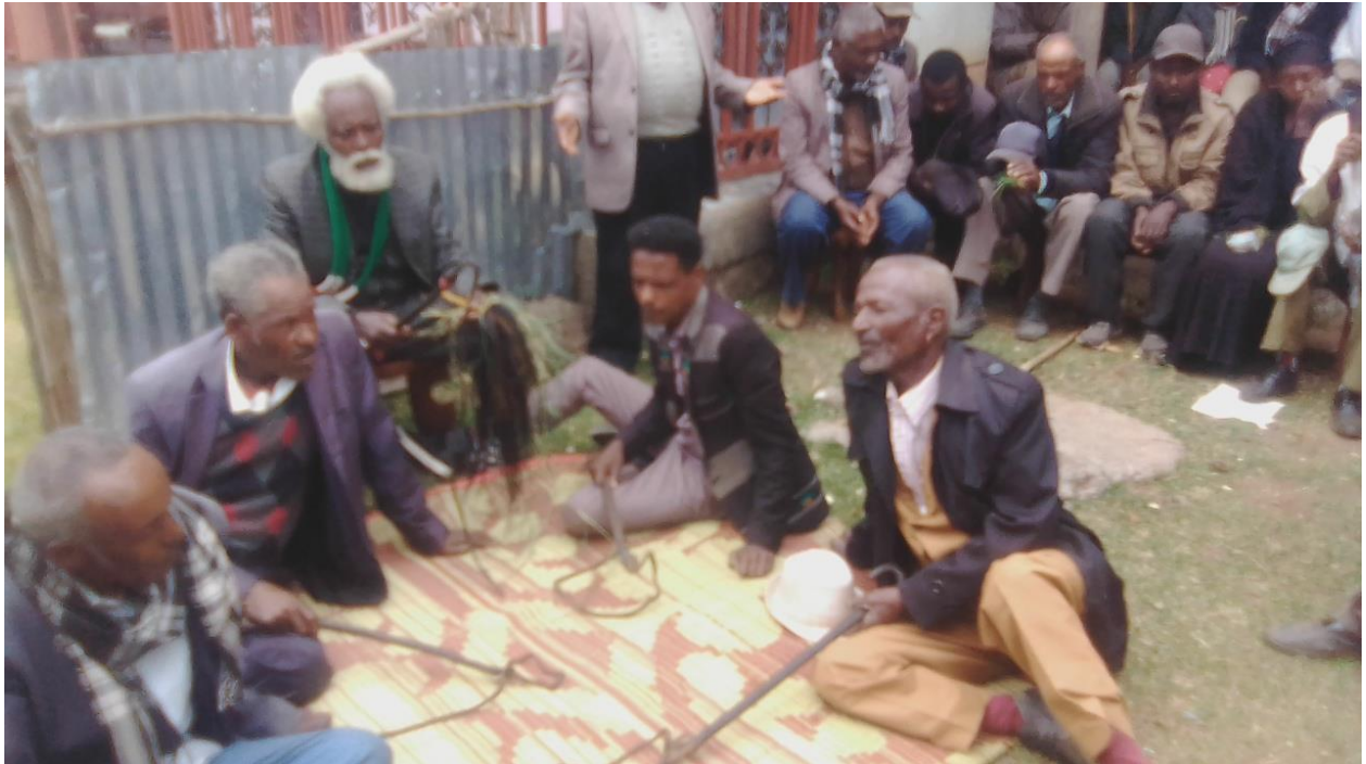
Suura 9 : Yeroo tumaa tumaanu magaalaa Diilalaatti qoratadhan kaafame.

Seeri guulaanii alangaa fi Coqorsaa qabatanii tumaamu kun alangaan gogaa gumaaroo irraa hojjetame baay'ee waan jabaatuuf mallattummaa akkumaa gogaa gumaaroo kanaa, seerii tumamus baay'ee kan jabaatu ta'u agarsiisa. Akka ragaan ragaa kennitoota irraa argamee addeessutti Coqorsi kenna uumamaa ittiin seera tumaani, ittiin namaa adabaniifi jiidha uumamaa jaarsooliin yeroo tumaa tumanu kan qabatamuudha. Kana malees abbootiin gadaa ni qabatu. Hawaasni Oromoos akka duudhaa hawaasaatii fudhatee jirata. Akkasumas, Coqorsi bakka alangaan hin jireeti alangaa bakka bu'uu waan danda'uuf mallattummaa angoo akka qabu hubatameera. Ciraan immoon meeshaa faacha fardaafi sibiila ykn mukarraa dhahamee hojjetamuufi seera gumaa tumu keessatti dhimma itti bahamuudha. Haalumaa kanaan meeshaalee ulfoo armaan olitti ibsamani fi Coqorsa qabachuun seerii tumamuu seera jabaa waan ta'eef Coqorsi seeraa gumaa tumuu keessatti walitti hidhiinsa jabaa fi mallattummaa nageenya fi taasgabbi, mallattummaa angoo qabachuu isaa hubachuun danda'ameera.