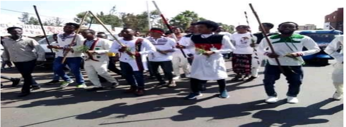
Suuraa: Daawwannaa gaafa 9/8/2014 Irreecha Arfaasaa Tulluu Horaa Ayeetuu Walisooti gaaggeefamee irraa qorataan kaafame.