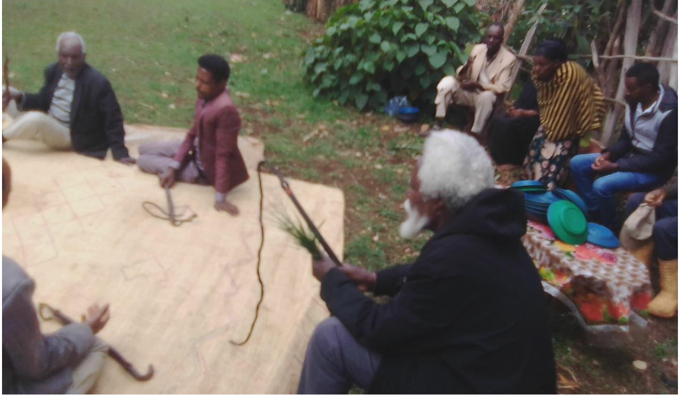
Suura :Guyyaa harka dhiqannaa yeroo seeraa tumaanu ganda Koonnoo Lafee Arbaati qoratadhan kaafame