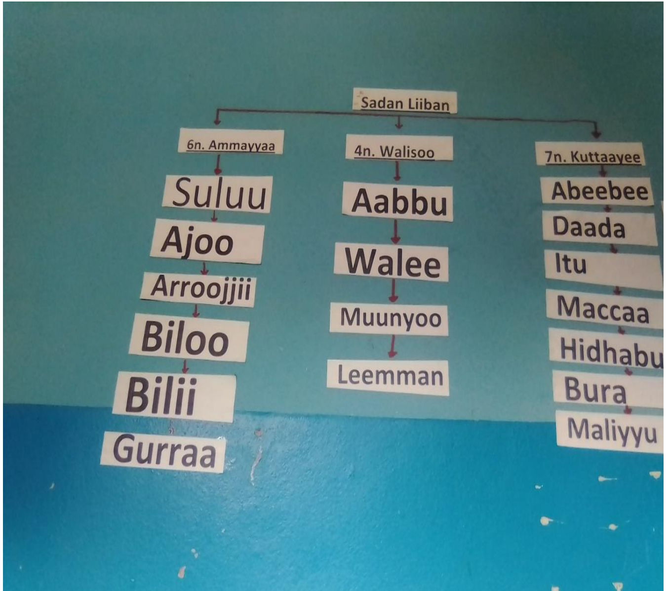
(Suura 3: Maddi ragaa hidda Latiinsa Oromoo Walisoo Liiban bara 2012 WAT Magaalaa Walisoo irraa argame)

yaa, Ilaamoo, Lakkuu, Sirbaa, Indarillaa. Jaawwiin balbalajaha qaba. Amurruu, Horroo, Jimma, Liiban, Giddaa, Eebantu. Daalleen, balbala, saddeet, qaba. Daallee, Leeqaa, Sayyoo, Sibuu, Tum'ee, Limmu, Noonnoo, Daannoo. Jiddaan balbala shan qaba. Akaako, Harbuu, Jimma, Saddacha, Baadii. "Liiban" latii Oromoo Maccaa keessaa isa tokkodha. Liiban balbala sadii qaba. Isaanis:- Ammayya, Walisoo fi Kuttaayeedha. Latiin sadaan Liibanii kunis, gabatee armaan gadii keessatti ibsamanirruu.