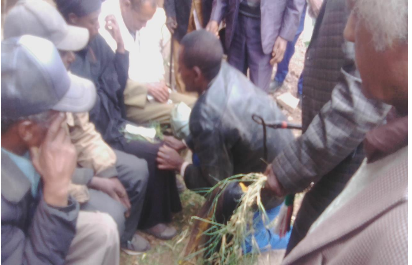
Suura7: Raawwii seeraa gumaa tumuu keessatti Coqorsaan yeroo araaraa raawwatanu qoratadhan kaafame

mallattummaa waadaa jabaan hin diigamne qabachuu addeessa. Akkasumas, jechaa isaan armaan olitti jedhan kanas kan jechisisuu A/Gadaatii. Yeroo jecha armaan dura kana karaa lachuun jedhanu abbaan gadaa fi jaarsooliinis Coqorsa harkaatti qabatani dhaabatanii waaqayyoo haa dhisu, 2x Waaqayyoo dabaa akkanaa hin fidinni, dhiigaa, dhaloota, kanummaan daarii isiniif haa ta'u, jechaa dhifama waaqa gaafata duutii lamata mana warra kanati akka hin seene Coqorsaan waaqa kadhatu. Warri dhifama gaafatanus lukoo isaanii hunda Coqorsa qabatani dhifama gaafachuun waliidhisu. Erga dhifama taasisaanniin booda mallattoo dhisuu isaanii waliif ibsuufi warreen ajjeesaan Coqorsa kennaanii gateettii isaanii dhungaatu. Isaanii miidhaan irraa gahees bakkumaa taa'anii jiraani irraa osoo olii hin jedhinni Coqorsa harkaa fuudhanii gateettii walii walii isaanii waldhungaachuun araaraan xumuru. Haaluma kanaan, adeemsa raawwi gumaa keessatti Coqorsi mallattummaa eebbaa, mallattummaa Kadhaa waaqaatiif, mallattummaa araaraa ittiin buusuufi mallattummaa galateeffannaadhaaf hojii irraa oleera.